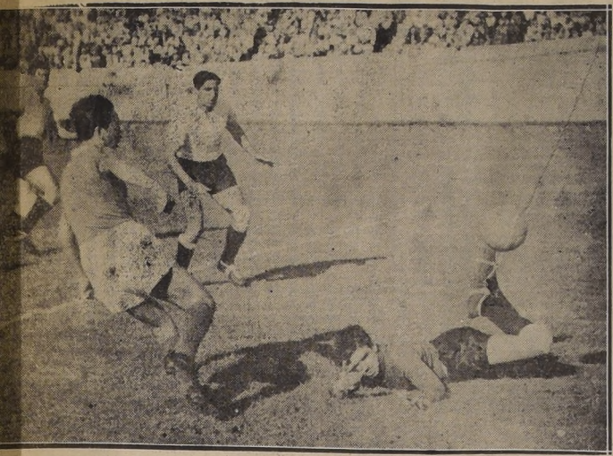
LA CANCHA.— Goal a Diano. Parece que la pelota picó mal por el gesto de desformidad que hace alarde el que hoy es guardavallas suplente de Boca Juniors. Ahora el field principal del Estadio Nacional está en inmejorables condiciones.