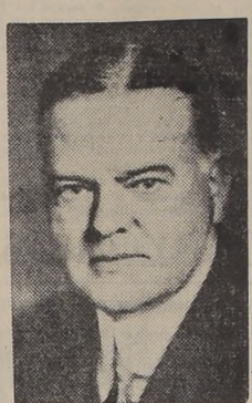
Mr. Herbert Hoover

Señalando que el Consejo de Alimentos de la ONU "tiene influencia sólo a parte de los países que lo componen", Hoover dijo que el futuro de Europa depende de un completo programa mundial de alimentos para 20 millones de niños desnutridos y enfermos del Continente.