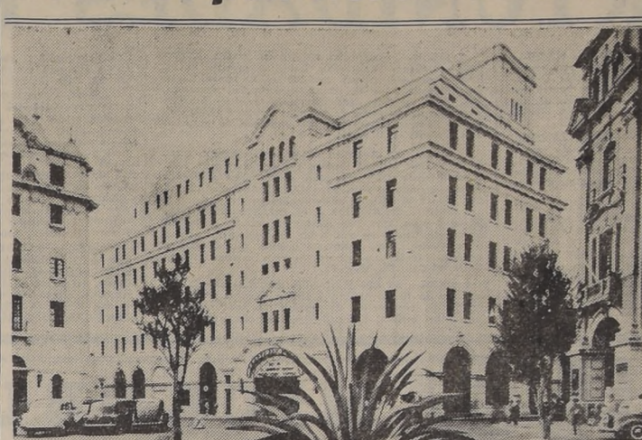
Un rincón de la Plaza de San Martín en la ciudad de Lima, donde fué firmado el nuevo acuerdo comercial chileno-peruano.