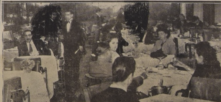
Aspecto tomado en Grill-Room del Hotel "Carrera", a la hora del almuerzo.