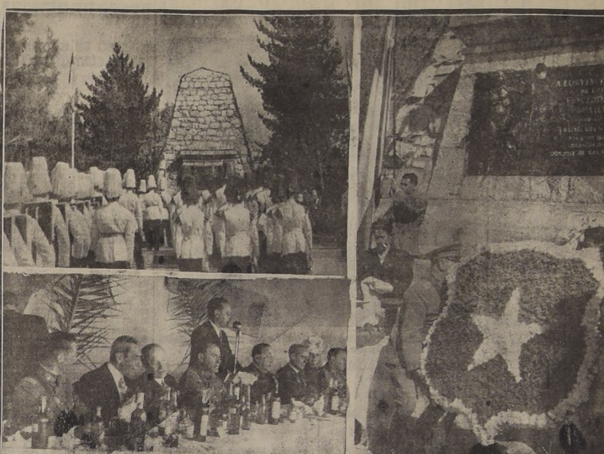
La Escuela Militar rinde honores frente al monumento a los vencedores de Maipú. Durante el almuerzo oficial había el Alcalde de Maipú.

El acto con el Himno de Aplicación, cantado por los alumnos y ex alumnos, además, un programa artístico. El acto con el Himno de Aplicación, cantado por los alumnos y ex alumnos, además, un programa artístico.