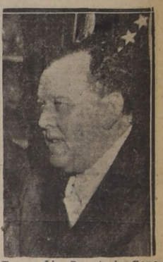
Trygve Lie, Secretario General de la ONU.