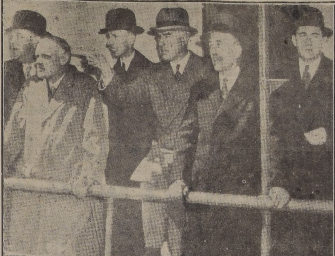
Los delegados de la ONU aprovechan un breve descanso para realizar una excursión en vapor por los alrededores de la bahía de Hudson.