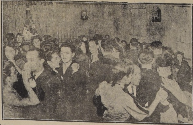
Estrecho se hace el local del "Millaray" del Hotel Carrera, a la hora del aperitivo, cuyo aspecto publicamos.