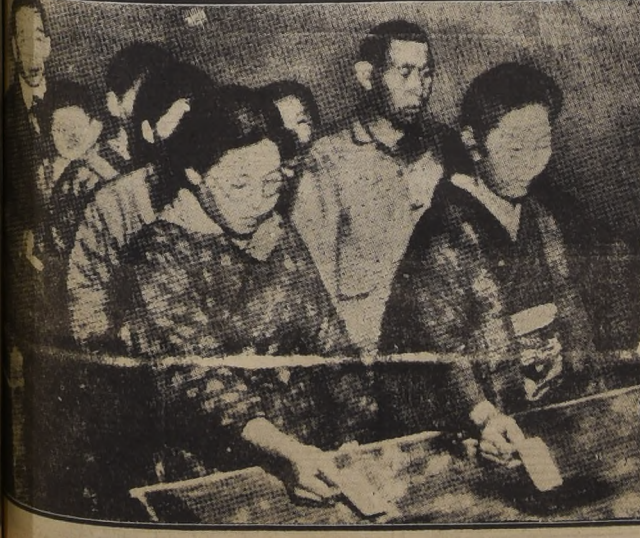
Accidente ferroviario en Eippen, Alemania. Se ve el tren derribado y a las personas involucradas.

SANTO PETERSBURGO, 22. — (Agencia France Presse). — Un accidente ferroviario ocurrió en Eippen, cerca de Graz.