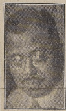
El ex Premier Shidehara