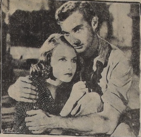
Una escena del fuerte drama de Jean Renoir, "El amor al terruño", que...