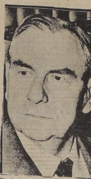
El juez Harlan Stone, presidente de la Corte Suprema de Estados Unidos