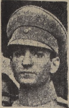
Mohamed Phalevi, Sha del Irán

El gobierno iraní reconocerá la autonomía de la provincia de Azerbaiján, según se anunció por el radio de Teherán.