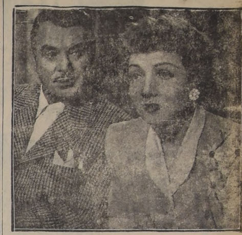
Luciendo los últimos modelos... diseñados por los más afamados...