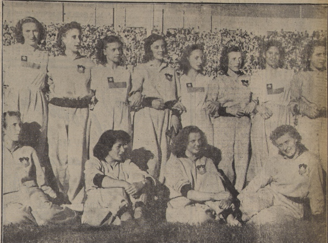
CAMPEONAS SUDAMERICANAS.—La representación femenina de Chile, y que dejó claramente demostrada su superioridad sobre las de los demás países

Argentinos, brasileños, peruanos, ecuatorianos, colombianos y chilenos, en hermosa justa, han ofrecido un espectáculo inolvidable y han estado juntos, en estrecha y sincera confraternidad, en esta puja caballerosa por un título. No hubo vencedores ni vencidos, ni rencores ni desalientos. Todos se respetaron y se aplaudieron. Están así como cuando empezó la gran jornada y siguen siendo hermanos. Los extranjeros, batieron sus palmas entusiasmados. El mejor del vencedor, junto a 50 mil personas que gritaron su fervor deportivo para proclamar en el espacio a su Chile, campeón!