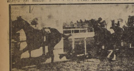
Copenhague delante de Macabeo, Remache e Insolente, en el premio "Luis Aldunate", como promisor principal de la tarde de ayer en el Club Hípico.

Apenas giraba la primera curva Clodius se pudo resueltamente del mando, seguido por