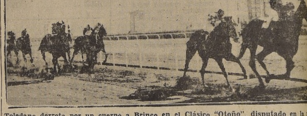
Tolledo derrota por un cuerpo a Brinco en el Clásico "Otoño", disputado en la tarde de ayer en el Hipódromo Chile. Tercero Moscardón a 2 1/2 cuerpos delante del jinete Picafort, que fué corrido en forma deficiente.

GLORY EN LA SEGUNDA. Glory dijo cuenta de Gallada y la favorita Serpentina en la segunda carrera de análogas bases a la anterior.