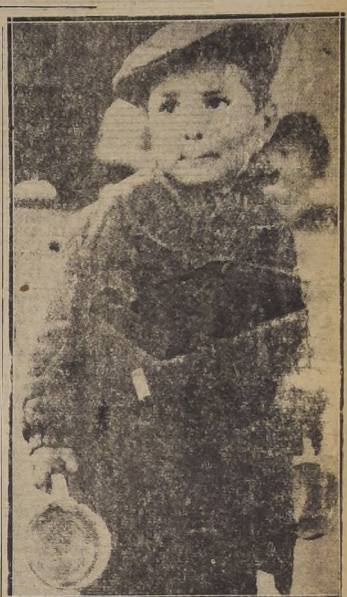
Un niño de Europa, víctima de la guerra recientemente terminada en el hecho, pero no en sus consecuencias.

"Al personal de obreros y empleados de la Empresa Periodística LA NACION, S. A., — Presente. Estimados compañeros: Nuestra organización se ha impuesto con verdadero placer de la iniciativa tomada por el personal de obreros y empleados de esa Empresa, en el sentido de hacer un llamado a nuestro pueblo, en especial a las clases trabajadoras del país, a objeto de que ayudemos a la ayuda de los niños necesitados de la Europa devastada por la horren-