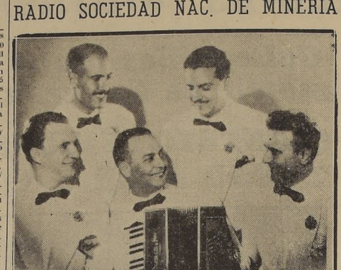
El sábado pasado debutaron en el local de Los Cantabricos un conjunto regional español...