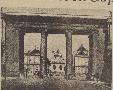
Entrada del Palacio Real en Copenhague