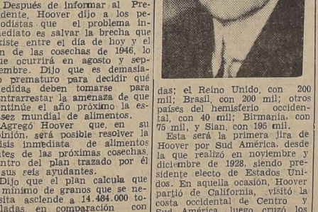
J. Edgar Hoover

WASHINGTON, 13.—(U. P.)—El ex Presidente de Estados Unidos, Herbert Hoover, que acaba de regresar de su gira mundial por las zonas afectadas por la escasez de alimentos, jira que hizo por encargo del Presidente Truman, hará un viaje a Sud América, para tratar de obtener más alimentos para dichas zonas.