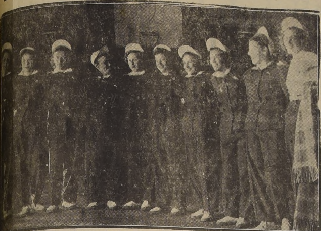
BRASIL.—El cuadro seleccionado del Brasil debutó anoche en el Campeonato Sudamericano de Básquetbol Femenino con un importante triunfo sobre Argentina por el score de 37-22. Su match con Chile es esperado con justificada impaciencia. El público la recibió con vivas demostraciones de simpatía.