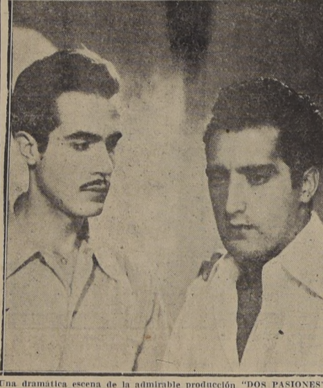
Una dramática escena de la admirable producción "DOS PASIONES", que Columbia Pictures estrena el martes próxima en el Teatro Continental.