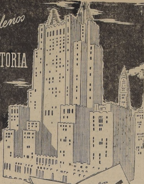
ESTE ES EL WALDORF ASTORIA, EL MAS GRANDE Y ELEGANTE HOTEL DE NUEVA YORK.

LA CASA BLANCA MANTIENE SU TRADICION DE EXCELENTES VINOS FINOS