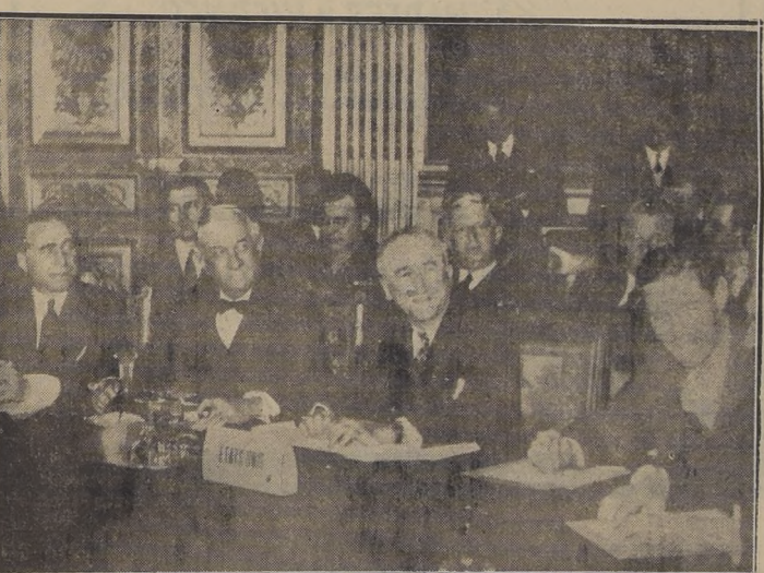
Aunque las cosas no van tan bien como se de sean, los delegados norteamericanos en la Conferencia de los Cancilleres muestran una cara sonriente al celebrar un chiste del señor Molotov, delegado ruso.

Antes del viernes resolverían si hay o no paz en Europa antes del próximo invierno