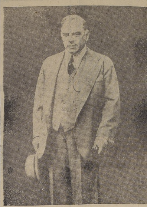
tres grandes líderes democráticos de la guerra que todavía encabeza el Gobierno de su país. Amigo íntimo del difunto Presidente Roosevelt, el señor King ha sido el arquitecto de la amistad que reina actualmente entre el Canadá y los Estados Unidos y a él se debe en gran parte el desarrollo del Canadá como potencia mundial durante la guerra recién pasada. Como era más joven, el señor King quería dedicarse a una carrera académica, cursando estudios en las universidades de Toronto, de Chicago, y Harvard. La vida de los barrios bajos de Chicago tanto le impresionó que el joven estudiante empezó a estudiar los barrios pobres de su propio país y relatar las condiciones que allí encontraba.

OTTAWA, junio de 1946 (IC).— El señor William Lyon Mackenzie King viene desempeñando el papel de Primer Ministro del Canadá desde hace veinte años. En junio de 1921 él era el estadista más joven de la historia de la nación canadiense llamado a encargarse de tan altas funciones. Hoy día el señor King sobrepasa el record de Sir John A. Macdonald, Primer Ministro, quien fue uno de los arquitectos principales de la Confederación Canadiense en 1867. El primer ministro King nació en Kitchener, provincia de Ontario, el 17 de diciembre de 1874. Empezó su vida pública al ser nombrado como Jefe del Partido Liberal en 1900. En 1909, se le nombró Ministro del Trabajo en el Gobierno Federal. El Primer Ministro, quien le llamó por primera vez al Gabinete, fue Sir Wilfrid Laurier el día