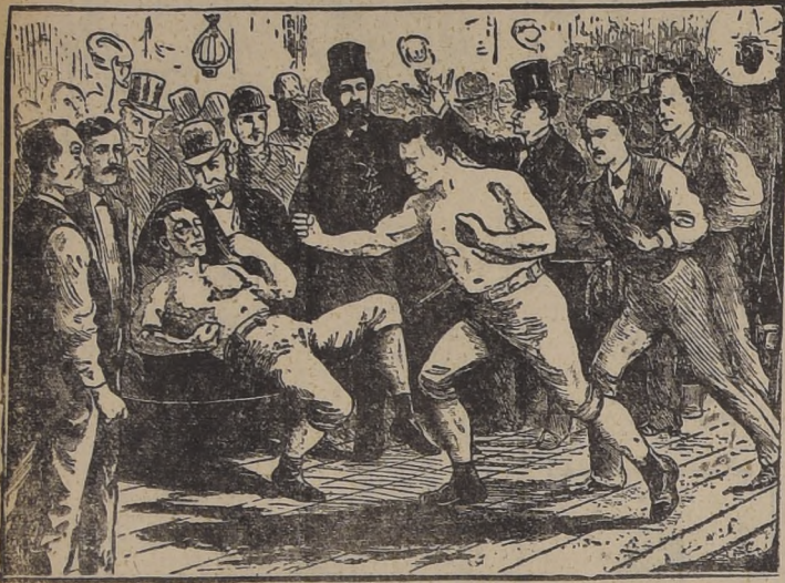
De un viejo archivo de box, encontramos este fotogrado que nos muestra el combate de Jackson con Mendoza ante numeroso público de la aristocracia inglesa. — La leyenda del grabado dice: el combate culminante cuando Jackson pope K. O. a Daniel Mendoza, campeón judío, allá por el año 1795