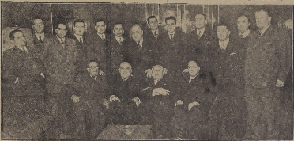
Miembros de la Junta Ejecutiva del Partido Democrático y otros políticos que visitaron ayer al Excmo. señor Duhalde

...RAS CONJETURAS reunión de dirigentes ...rda con el Excmo. Duhalde dió pábulo a ...varios comentarios ...círculos políticos que ...conocimiento de ella. ...a con marcada insis-