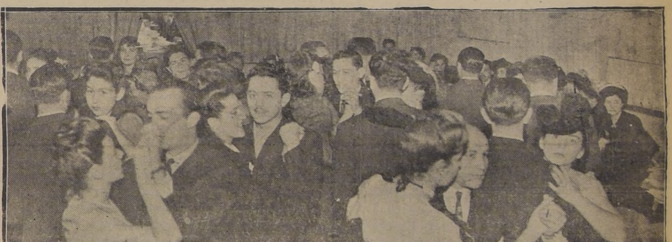
Aspecto parcial de la Boite "Millaray", uno de los night clubs más concurridos de la capital.