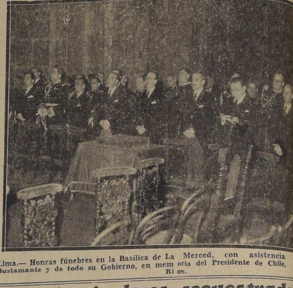
Lima.— Honras fúnebres en la Basílica de La Merced, con asistencia del Embajador de Chile en esta capital, el Embajador de Costa Rica y otros miembros del Cuerpo Diplomático.