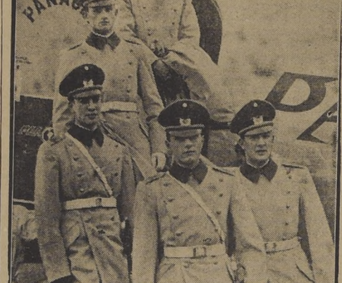
CADETES MILITARES A ALPATACAL