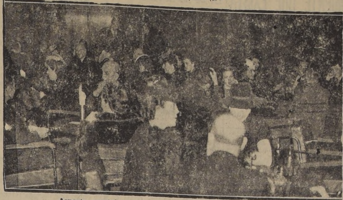
Aspecto parcial tomado en el Bar Central del Hotel Carrera