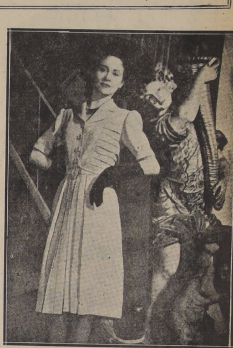
Vestido de tarde en jersey negro, faldón drapeado sobre las caderas, en satén negro. Sombrero de terciopelo negro y aigrettes. Modelo de Jean Patou.—2. Traje de noche de Marcel Rochas en surah escocés azul grisado y rosa. Flores de mañana en lana a cuadros beige y marrón. Modelo de Maggy Rouff.—3. Vestido de Marcel Rochas, en lanilla de color gris perla, adornado de alforzones.