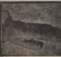
Los accesorios del tocado. Guante de gamuza verde, forrado con conejito.