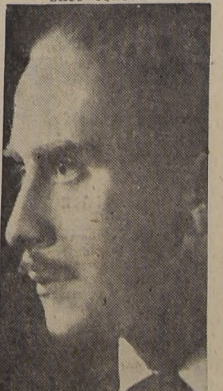
Claudio Arrau, nuestro genial pianista patriota, que realiza en el Teatro Municipal una serie de conciertos con el más ruidoso éxito que pueda imaginarse.