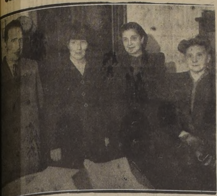
Comité del Centro de Padres y Apoderados de la Escuela Normal N.º 2 de Santiago, que vino a entregarles cuota de julio para los niños desamparados

En todo el país sigue encontrando la más amplia acogida la llamada por el personal de obreros y empleados de LA NACION, de que todo trabajador, de un extremo al otro del territorio, aporte la módica suma de un peso mensual para acudir a la ayuda de los niños necesitados de Europa y de Chile.