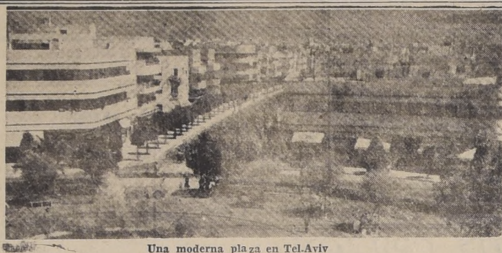
Una moderna plaza en Tel-Aviv

El Ministerio de Colonias manifestó que esta orden estaba fechada "después del desastre ocurrido el 22 de julio — cuando se produjo el atentado dinamitero — y debió ser entregado a los interesados la misma tarde que cayó en mano, de los británicos. La mencionada orden indica que la explosión del King David Hotel, interrumpió los planes bien estudiados del "Haganá" para lanzarse en una lucha sin cuartel contra el Ejército británico si éste persistía en sus alineamientos dentro de los poblados judíos.