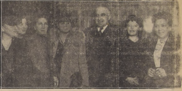
El Excmo. señor Duhalde, rodeado de damas radicales

Naturalmente, por encima de toda aspiración estará siempre la necesidad de cuidar el factor hombre: defender la raza que es defender la vida de todos. El Estado debe encargar suelta y definitivamente todo lo que concierne a la preservación y cuidado del factor hombre, del ciudadano. Y debe acometerla desde su fundamiento, desde niño. El niño chileno necesita vestuario y alimentación adecuada. Pues bien, mi Gobierno trabajará sin descanso para que esta as-