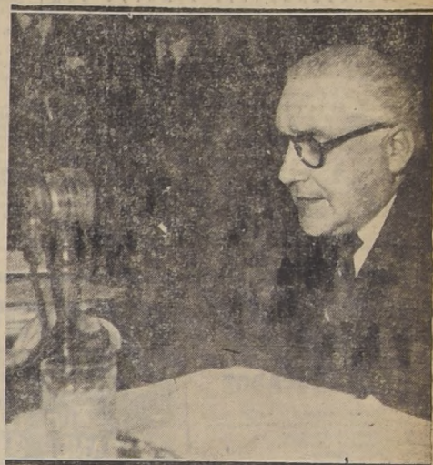
El Excmo. señor Alfredo Duhalde durante la lectura de su discurso

Creo que a través de todo el curso de nuestra historia republicana, con la sola excepción de los primeros y turbulentos días en que se establecieron las instituciones básicas, que han regulado entre nosotros el ejercicio del poder público, nunca había asistido el país a un proceso más activo en