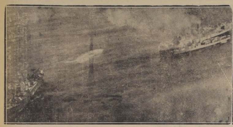
El "Duque de Caixas", incendiándose en las proximidades de Rio de Janeiro.