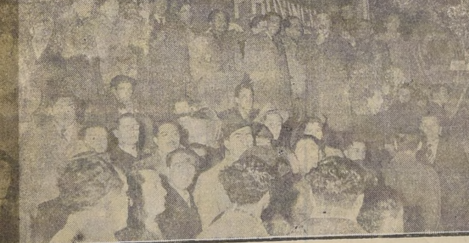
Detalle del comicio público realizado por la CTCH. Provincial de Santiago, filial de la efectiva Nacional que preside el señor Bernardo Ibañez, en pro de la aprobación de los proyectos de ley sobre pago de la semana completa e indemnización de un mes por año de servicio, a los obreros de todo el país.

El Club de Deportes Javiera Carrera ha organizado un baile que tendrá lugar en el local de Alameda.