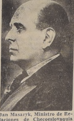
Jan Masaryk, Ministro de Relaciones de Checoslovaquia

presentando. Hizo su proposición a modo de transacción para solucionar la disputa acerca de los dos tercios de mayoría de votos para la adopción de decisiones.