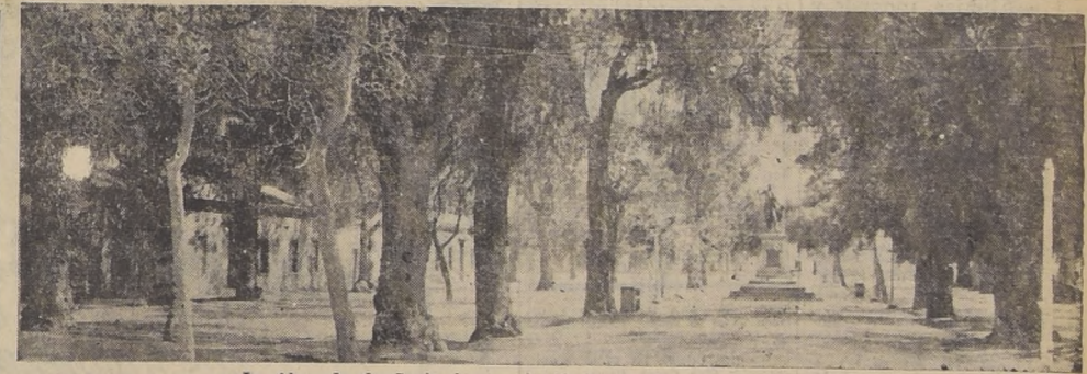
La Alameda de Copiapó, que sirvió de refugio a la población.

Personal técnico salió a recorrer la vía. INFORMACIONES DE NUESTROS CORRESPONSALES EN COQUIMBO, 2.—Un fortísimo movimiento sísmico se dejó sentir a las 15.22 horas en esta ciudad. El temblor alcanzó fuerza 6, durando más o menos un minuto, causando un gran pánico en la población, que en su gran