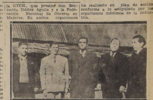
Nueva directiva del "Sindicato Profesional de Obreros en Barracas", que desarrolla una activa labor sindical y social.

El Sindicato Profesional de Obreros en Barracas, ha estado en este último tiempo trabajando activamente, en llegar a una efectiva labor en diversos problemas especialmente en lo que se refiere a la situación económica y social del gremio.