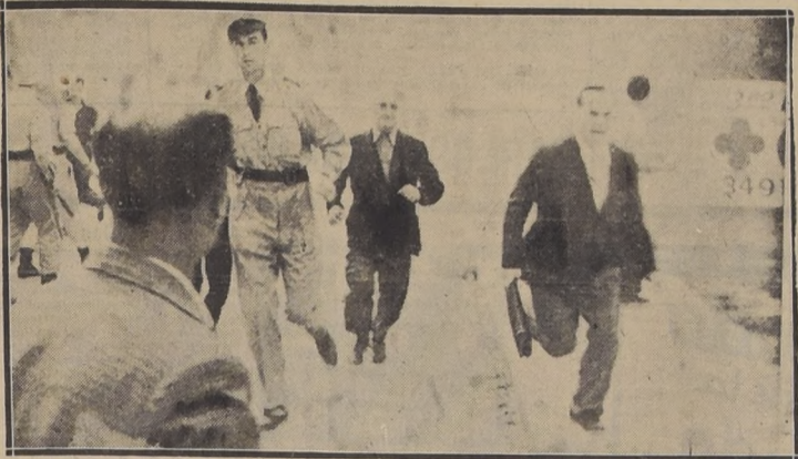
GORIZIA, Italia.—Durante una reciente manifestación de patriotas italianos, celebrada en esta región, algunos simpatizantes de Yugoslavia procuraron disolverla o interrumpirla con muy poco éxito, pues fueron dominados por los agredidos. En este tumulto, que duró dos horas, resultaron 30 personas heridas.