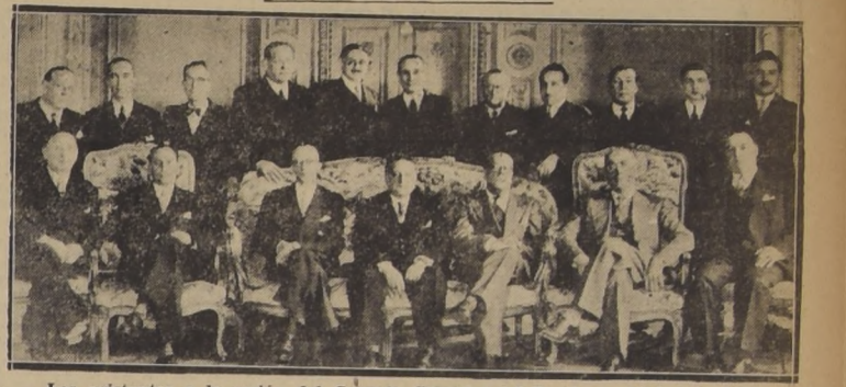
Los asistentes a la sesión del Consejo Superior del Bando de Piedad de Chile

IMPORTANTE SESION DE ANIVERSARIO CELEBRO SU CONSEJO SUPERIOR, EN LA QUE SE INCORPORARON LOS NUEVOS CONSEJEROS, LOS EMBAJADORES DEL BRASIL Y PERU