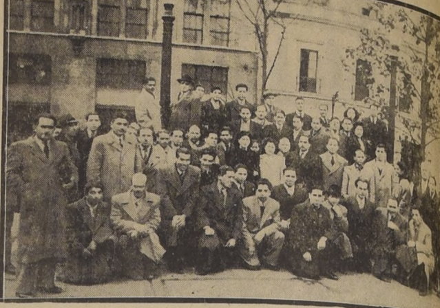
Grupo general de los dirigentes de organizaciones gremiales de la Beneficencia que van el mejoramiento de su situación económica.

Los directores de las organizaciones sindicales de Empleados de Beneficencia se movilizaron ayer con motivo de la reunión ordinaria que correspondía celebrar a la Cámara de Diputados, en la cual se trataría el proyecto de ley enviado al Congreso por S. E. el Vicepresidente de la República y los Ministros de Salubridad y Higiene, por el cual se destinan $ 60.280.116 para mejorar la situación económica de dichos personales a través del país. La sesión aludida, desafortunadamente, no se realizó por falta de número, quedando pendiente el estudio y resolución del proyecto. Nos dijeron en seguida que debían repetir el difícil estado de su situación económica, debido a los bajísimos sueldos que tienen estos servidores, dignos de una mayor consideración por parte del Estado y de la sociedad en general. PARTES DEL PROYECTO El proyecto en referencia establece en su artículo 1.º que se autoriza al Presidente de la República para subrogarse a la Junta Central de Beneficencia y Asistencia Social, para la suma indicada, a fin de pueda pagar su personal mejorado, aunque sea en forma reducida, las rentas de sus personales.