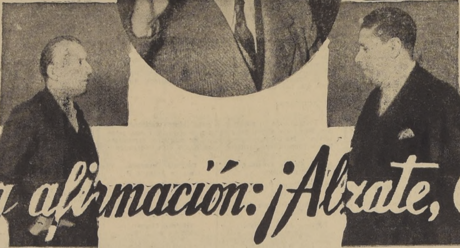
PEDRO AGUIRRE CERDA, EL "ESPIRITU DE LOS ANDES", DIJO A SU PUEBLO: "O NOS UNIMOS O PERECEMOS"

nacional entre clientelas partidistas. Entrega su mayor afecto a la juventud, y por eso la hace depositaria del porvenir de la patria; pero no basta que la nueva generación acepte el símbolo frío del futuro y permanezca en quietud cobardes y suicidas. Debe ocupar un puesto en las barricadas del pueblo dándole su fe, su decisión y esa vitalidad de sangre y mente nuevas, incontaminadas y fecundas. Asegura e. m. s. l. que no "ara en el mar", que la decepción de unos e indiferencias de otros, se galvanizarán pronto en una mística común, y que Chile, de-