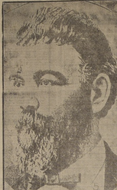
John C. Morrissey, el norteamericano que en 1853 en New York derrotó a Sullivan. Fue proclamado campeón de América y ha sido el primer pugil que ocupó un asiento en el Congreso de su país.