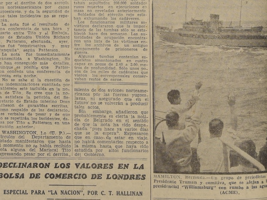
HAMILTON, Bermuda.— Un grupo de periodistas se reúne con el Presidente Truman y comitiva, que se alejan a bordo del "Williamsburg" con rumbo a las aguas del Atlántico.