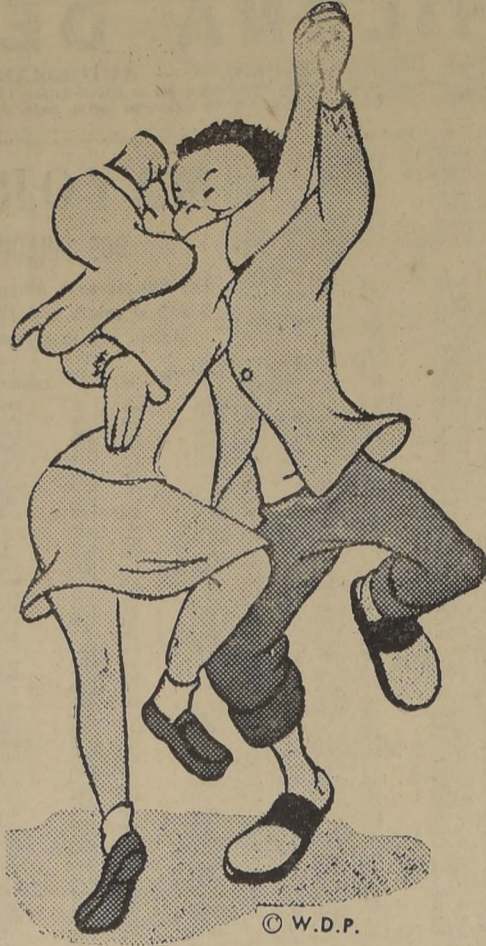
Al ritmo de la música de Swing esta pareja se dedica a bailar con contagioso entusiasmo en una de las secuencias de la película MUSICA MAESTRO...