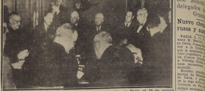
Los Ministros de Relaciones de los Cuatro Grandes reunidos en París, el 29 de agosto último, con el objeto de salvar la amenazada Conferencia de Paz.