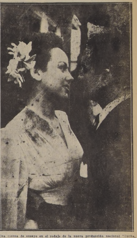
Una escena de ensayo en el rodaje de la nueva producción nacional "Sueña, mi amor"...