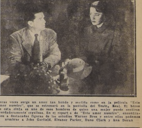
Pocas veces surge un amor tan hondo y sentido como en la película "Este amor nuestro"...