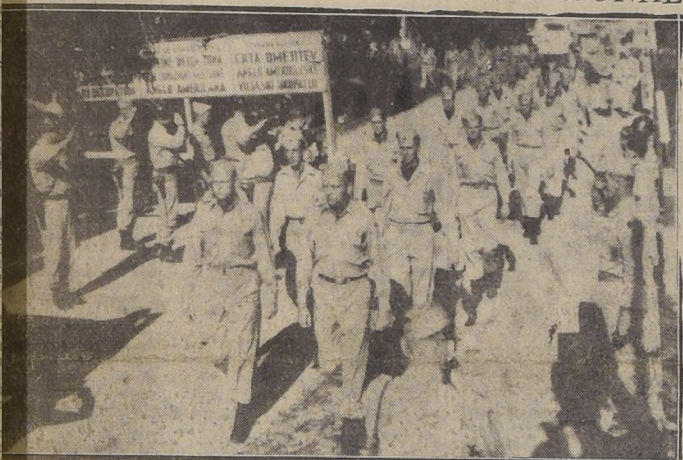
ITALIA.— Los restos de los cinco aviadores norteamericanos que fueron derribados sobre Yugoslavia, durante un ataque de aviones de caza yugoeslavos contra los deportes en que viajaban, cruzan la Línea Morgan para pasar a custodia de las fuerzas americanas. Fuerzas de la 88.ª División acompañan los restos hasta un puesto ubicado a cinco kilómetros al Este de Goritzia.