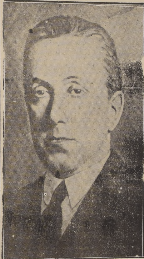
Con motivo de ser mañana Sábado 7, el cuarto aniversario de su fallecimiento, se oficiará una misa por el eterno descanso de su alma en la Gracituda Nacional, a las 10