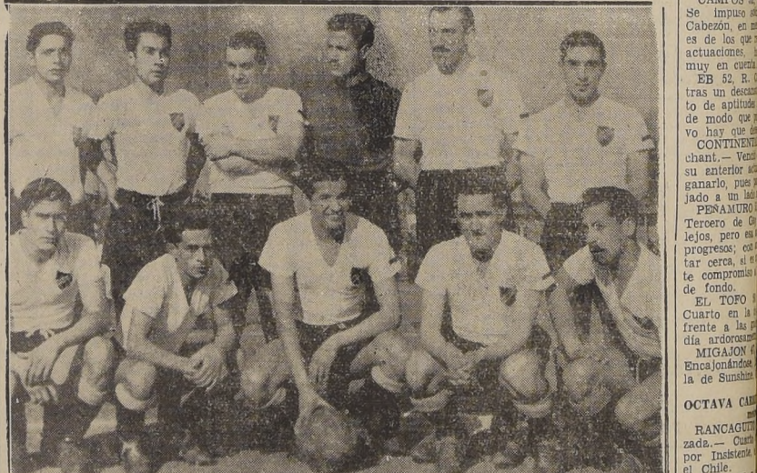
PRESENTO CAMPEON — Conjunto de Colo Colo F. C. que sigue de puntero en el campeonato oficial de fútbol de las reservas de la División de Honor, y sin haber perdido un solo partido en toda la temporada. Los albos vencieron ayer al Magallanes por tres a dos

AYER VENCIO AL MAGALLANES, POR 3 A 2, Y SE MANTIENE INVICTO Y PUNTERO. — UNIÓN ESPAÑOLA GOLEO AL AUDAX, POR 6 A 2. — TAMBIEN GANARON LAS UNIVERSIDADES Y EL G. CROSS