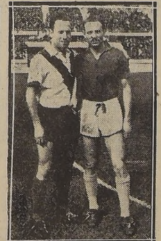
INFANTE.— Novel centro delantero de U. Católica y auténtica esperanza del fútbol profesional

Los equipos de Audax y U. de Chile tienen difíciles contendores en Universidad Católica y Colo Colo, respectivamente. El partido de Audax y U. de Chile es de un interés bien especial se presenta un empate con Everton, en vira, se le puede poner capaz de postergar las aspiraciones de Magallanes. — MAÑANA Y EL DOMINGO SE CUMPLIRAN LA 17.ª FECHA DEL CAMPEONATO OFICIAL DE FUTBOL PROFESIONAL