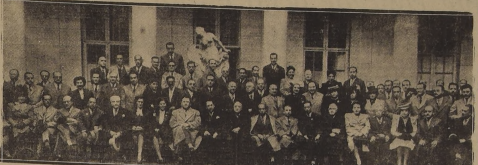
Parte de los delegados que participaron en la Convención Odontológica