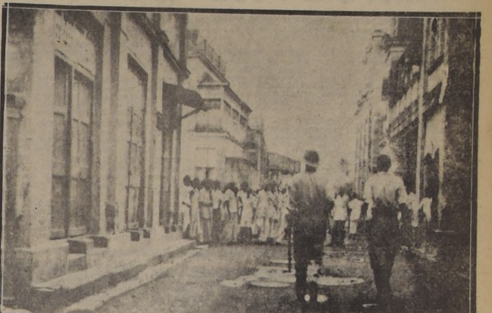
BOMBAY (India).—Grupos de Indios reuniéndose en una angosta calle de Bombay, mientras se detiene a los causantes de los desórdenes de los últimos días entre musulmanes e hindúes. — (Foto ACME).