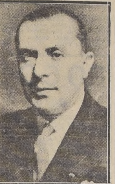
Don Gabriel González Videla. EL SR. GONZALEZ SERA ELEGIDO EN LA PRIMERA VOTACION