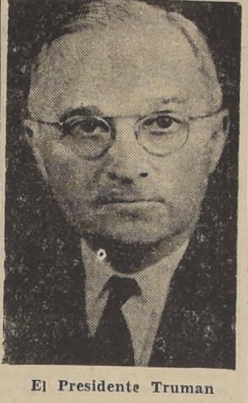
El Presidente Truman

que laborar intensamente nunca en busca paz verdadera