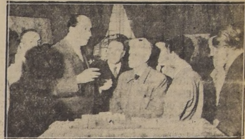
El Alcalde de Santiago explica a los periodistas detalles de proyectos.