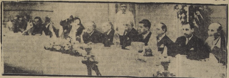
La Mesa de Honor durante el almuerzo que los parlamentarios chilenos ofrecieron a mediodía de ayer a sus colegas extranjeros que nos visitan.

Dijo a continuación que Chile ha dado una lección de acatamiento a los designios de la multitud y a la voluntad del pueblo.