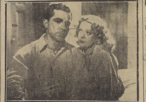
Un film de intenso dramatismo que estrenará hoy en su pantalla el Teatro Central, y en el cual actúan como principales figuras, Linda Darnell, Alice Fa-

LINDA DARNELL EN UNA PELICULA QUE ESTRENA HOY EL TEATRO CENTRAL