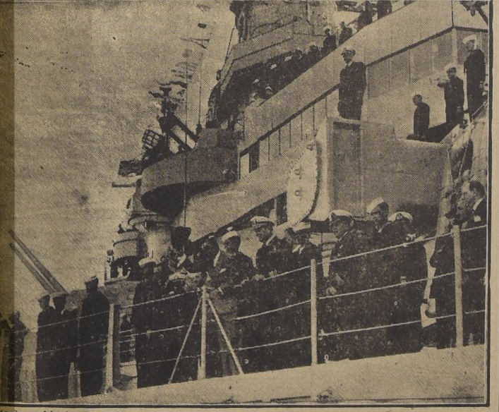
La cubierta del "Wisconsin", el Presidente de Chile responde a las aclamaciones de que es objeto.

Finalmente el Canciller nos manifestó que mañana miércoles, a las 18 horas, recibiría de nuevo a la prensa para hacer declaraciones más amplias respecto de la posición que adoptará Chile en materia internacional.