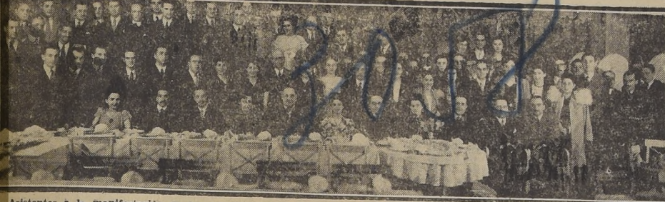
Asistentes a la manifestación de los estudiantes del último curso de Leyes realizada en los salones del "Capri"