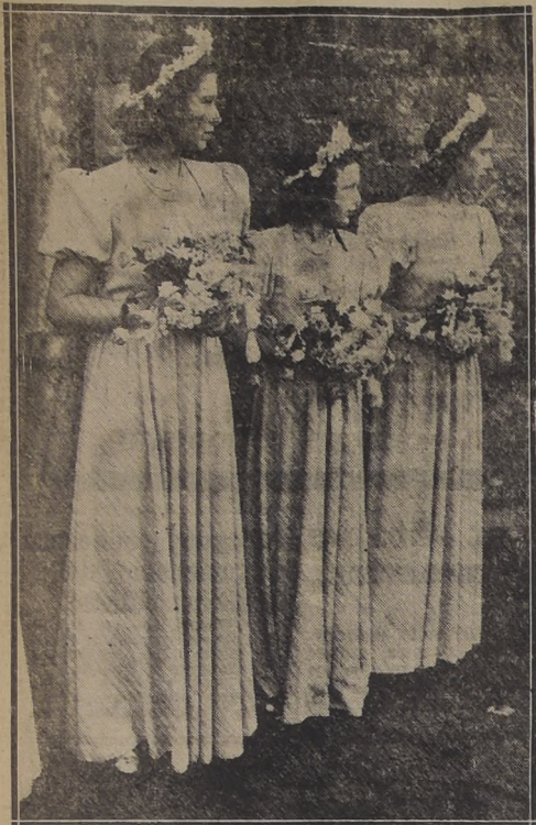
Las tres princesas de Gran Bretaña, durante el matrimonio de la hija de Lord Luis Mountbatten. De izquierda a derecha, princesa Isabel, heredera del trono británico; la princesa Alejandra de Kent, y la princesa Margaret Rose, después de efectuarse la ceremonia.