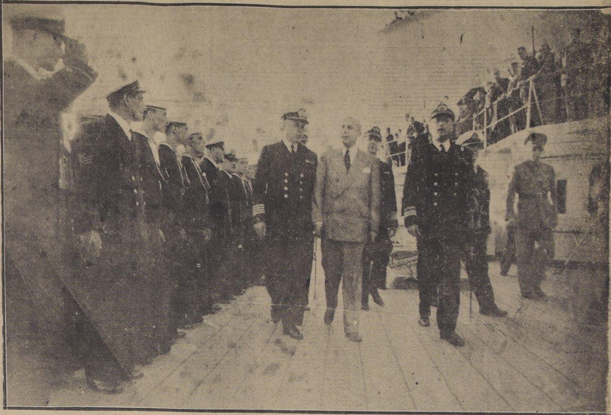
El Excmo. señor González Videla a bordo del acorazado "Almirante Latorre"