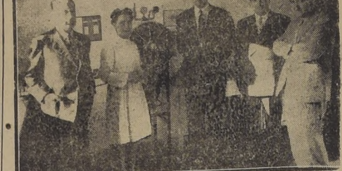
El Ministro de Agricultura, señor Miguel Concha, durante la visita que hizo a los departamentos técnicos de esa Secretaría de Estado, en la tarde de ayer, para imponerse de su funcionamiento y necesidades.

El Ministro de Agricultura, señor Miguel Concha, después de realizar una detenida visita a todos los departamentos técnicos y científicos de esa Secretaría de Estado, nos declaró que el Gobierno estimulará por todos los medios a su alcance la notable tarea de investigación que realizan los funcionarios de los departamentos mencionados en el decreto ley N.º 153, de 7 de julio de 1932, sea que ellos ocupen a título gratuito o como arrendatarios del Fisco.