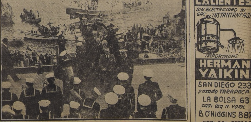
S. E. y comitiva llegando al superacorazado norteamericano "Wisconsin"