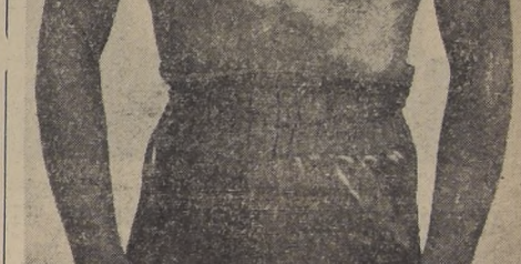
ENRIQUE IRURETA, el campeón uruguayo que hoy hará empiezas a fondo a Salinas

Los defensores del México B. C. y Traviarios están entregados con todo entusiasmo a una preparación adecuada a fin de obtener el máximo de sus condiciones físicas para poder actuar en el sábado próximo en la noche en la primera rueda final del campeonato cuadrangular de boxeo. El comité local de los aztecas ubicado en calle San Pablo 1087, seguramente se hará estrecho para contener la numerosa concurrencia que se espera concurrirá a presenciar las incidencias de los encuentros anunciados. Ha locado en suerte que hayan quedado para definir el torneo en referencia, dos de nuestros más poderosos clubes, como lo son el México B. C. y Traviarios, instituciones que cuentan en sus filas con un grupo de destacados