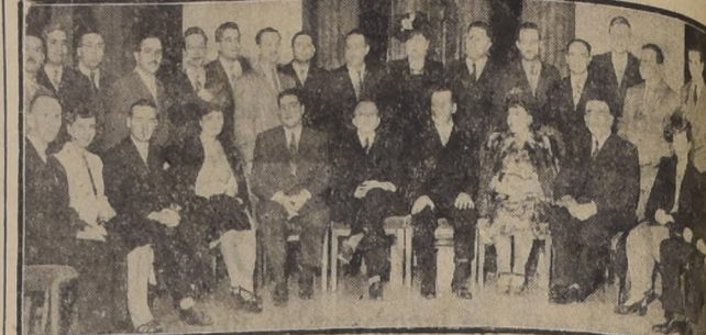
Asistentes a la comida ofrecida en el hotel Carrera, a los profesores de la Facultad de San Marcos de Lima, por la Facultad de Química y Farmacia de la Universidad de Chile.