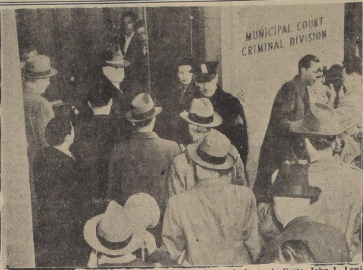
WASHINGTON.— Llega el jefe de los mineros para su lucha en la Corte, John L. Lewis, presidente del Sindicato de Mineros, para una mirada al público antes de entrar a la Corte Federal de Distrito, para explicar por qué no debe censurarse por haber desobedecido una orden de la Corte, y poner fin a la huelga del carbón.—.

LAKE SUCCESS, 3.— (U. P.)— El presidente del Comité Político y de Seguridad, abrió la sesión a las 15.15, y en seguida se reanuda el debate sobre el asunto español.