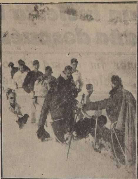
MEIRINGEN, Suiza.—Guías alpinas llegan donde las víctimas del accidente del "Dakota". Los guías suizos que fueron los primeros en llegar al sitio en que se accidentó el avión "Dakota", que viajaba de Istres a Munich, prestan auxilios a una pasajera que yace en la nieve. De pie, al centro, con lentes, está otro de los sobrevivientes del accidente.

Se ignora hasta el momento el número de las bajas resultantes de la lucha.