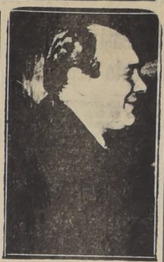
Paul Henri Spaak

Al acto de cremación sólo asistieron los funcionarios del cementerio. Sus cenizas quedarán depositadas más tarde en el edificio de la Unión Panamericana. El homenaje póstumo al difunto se realizará el día que se designa, en sesión solemne de la Unión Panamericana, a la cual asistirán los miembros del Cuerpo Diplomático, personalidades oficiales y destacadas figuras de esta capital.