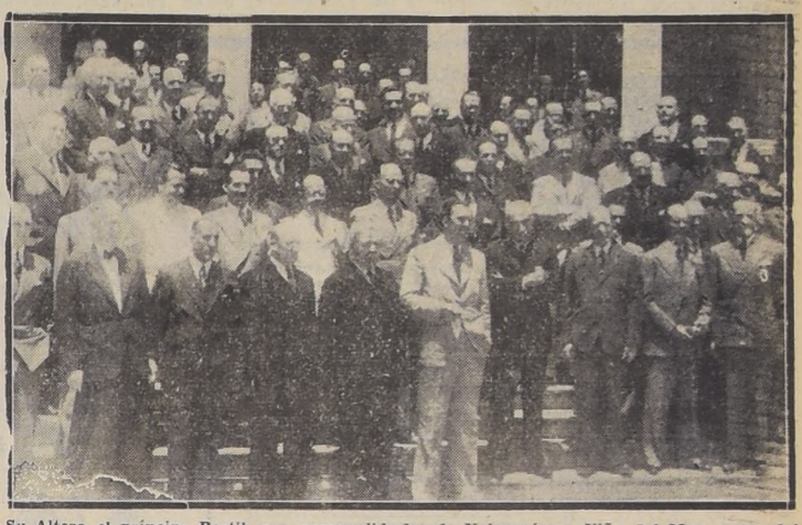
Su Alteza el principe Bertil, con personalidades de Valparaíso y Viña del Mar, antes del almuerzo que se le ofreció ayer.

LOS ILUSTRES HUESPEDES ESTUVIERON AYER EN VALPARAISO Y VIÑA DEL MAR. HOY VISITARAN ALGUNAS INDUSTRIAS. MAÑANA PARTEN A CONCEPCION PARA SEGUIR AL SUR. DESTACADO HOMBRE DE NEGOCIOS ESTIMA QUE LA MISION AL CANZARA MUY BUENOS RESULTADOS.