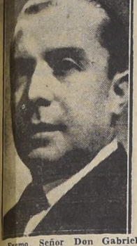
Excmo. Señor Don Gabriel González Videla.

EL PRESIDENTE DE LA REPUBLICA HIZO AYER IMPORTANTES DECLARACIONES A LOS PERIODISTAS