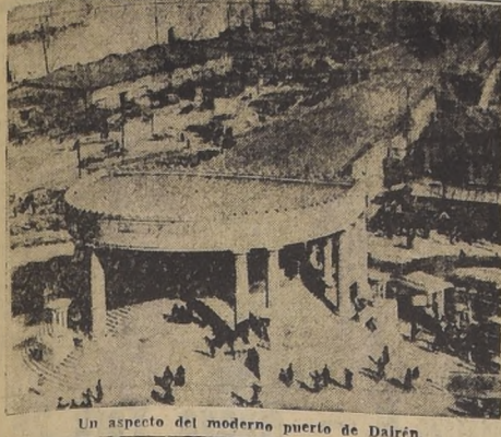
Un aspecto del moderno puerto de Dairen.