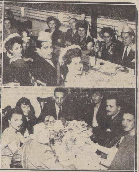
ASPECTO DE LA CENA DE NAVIDAD