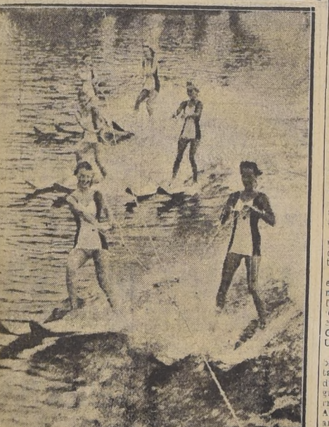
EXPRESS GAEDENS, Florida.— Aquí vemos a un grupo de atletas bahinistas preparándose para el gran "rodeo" acuático que se celebrará en esta ciudad el 29 del actual. — (Foto ACME).