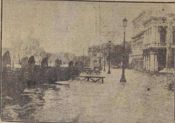
VENECIA, Italia.— Las gondolas, el famoso medio de locomoción acuático de Venecia, abandonaron sus canales por primera vez en la historia al quedar toda la ciudad bajo el agua. En la famosa Plaza de San Marcos, el agua llega 14 pulgadas de profundidad, después que los canales se salieron de madre debido a lluvias torrenciales que duraron tres días.