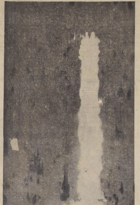
WHITE SANDS, Nuevo México.— Un cohete V-2 para batir récord mundial, con una estela de llama amarillada...

Participan dos expediciones americanas, dos inglesas y una rusa.— Preparan expediciones Chile, Argentina y Noruega