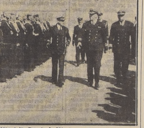
Jefes de la Armada, llegan a la Escuela de Máquinas y Electricidad

LA CEREMONIA SE EFECTUO A LAS 16 HORAS DE AYER.