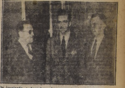
De izquierda a derecha, el representante de LA NACION con los dos oficiales de la Marina Argentina que van a la Antártica.