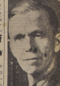
General George C. Marshall

WASHINGTON 7. — (U. P.). Presentó su renuncia el Secretario de Estado James F. Byrnes. El Presidente Truman anunció que lo reemplazará en el cargo el general George G. Marshall.