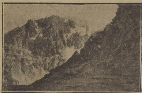
Parte del sector cordillerano en que se encuentra el ventisquero que hoy será bombardeado