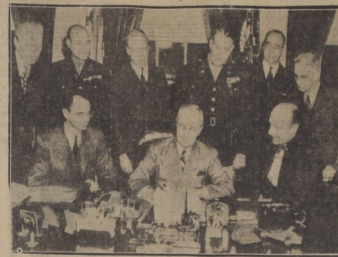
WASHINGTON. — En una ceremonia realizada en la Casa Blanca el 31 de diciembre de 1946, el Presidente Truman firmó la orden que transfiere el control sobre la bomba y energía atómica a una comisión civil...

Razones de salud provocaron la salida de Mr. Byrnes del Gobierno de Truman. Dentro de diez días asume G. C. Marshall