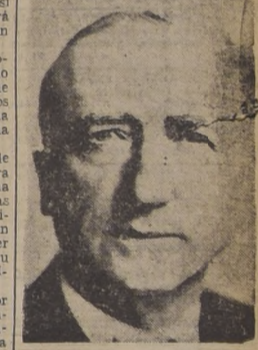
James F. Byrnes

las cuales tiene aquella fecha, en que el Secretario dimite dice: "Yo me conozco y sé que no puedo reducir el ritmo de mi actividad mientras ocupo un cargo público, especialmente el de Secretario de Estado".