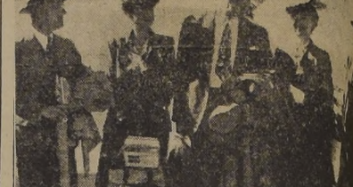
Turistas norteamericanos que llegaron ayer por vía aérea. En un cuadrimotor Douglas DC-4 de la Panagra llegó en la mañana de ayer a Los Cerrillos, procedente de Lima, un grupo de turistas norteamericanos...