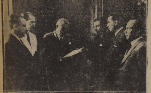
S. E. se impone de las peticiones de los Grupos Funcionales Radicales

LE HIZO ENTREGA DE UN MEMORANDUM CON PETICIONES