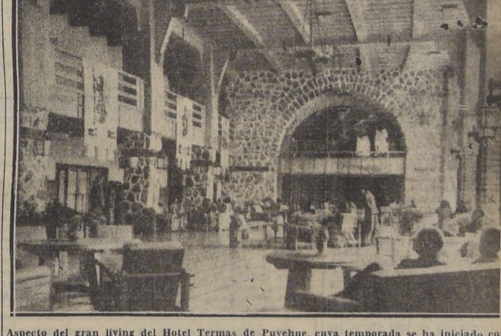
Aspecto del gran living del Hotel Termas de Puyehue, cuya temporada se ha iniciado con extraordinario éxito.