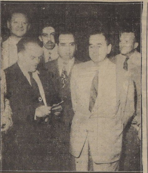
El nuevo Ministro de Hacienda, señor Germán Pico Cañas, hace declaraciones a LA NACION, momentos después de asumir esa Cartera de Estado.

Las asambleas mencionadas acordaron en señal de protesta, paralizar las labores hoy a las 11 hrs.