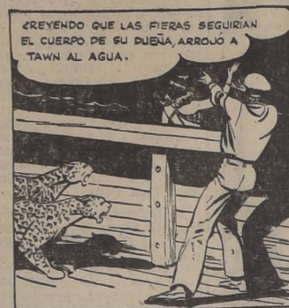
CREYENDO QUE LAS FIERAS SEGUIRIAN EL CUERPO DE SU PUEBLO, ARROJÓ A TAWN AL AGUA.