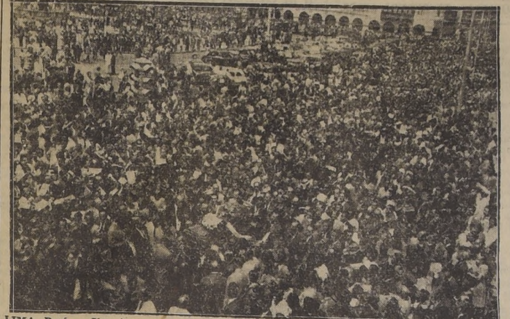
LIMA, Perú.— Una inmensa muchedumbre desfiló silenciosamente ante el Palacio Presidencial, en la Plaza de Armas de Lima, rodeando el ataúd que es conducido al Cementerio Graña Garland, asesinado misteriosamente en las primeras horas de la noche del 7 de enero, al salir del Instituto Sanitas, del que era Gerente.

Declaró el Canciller uruguayo en el Instituto de Asuntos Internacionales de Cleveland