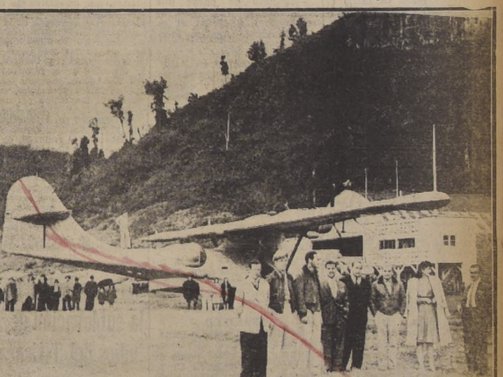
El Aeropuerto del Gran Hotel Termas de Puyehue, que es visitado constantemente por grandes aviones, tanto del país como del extranjero, momentos después de aterrizar un anfión Catalina.