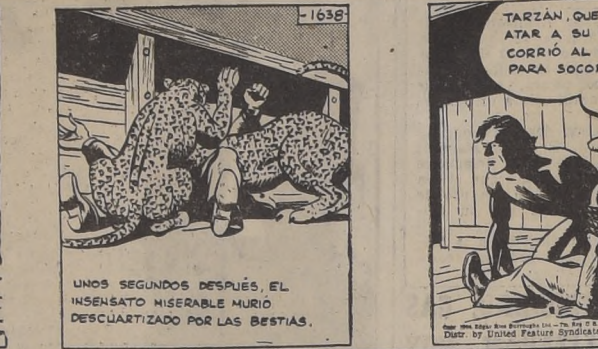
UNOS SEGUNDOS DESPUÉS, EL INSENSATO MISERABLE MURIO DESCUARTIZADO POR LAS BESTIAS.