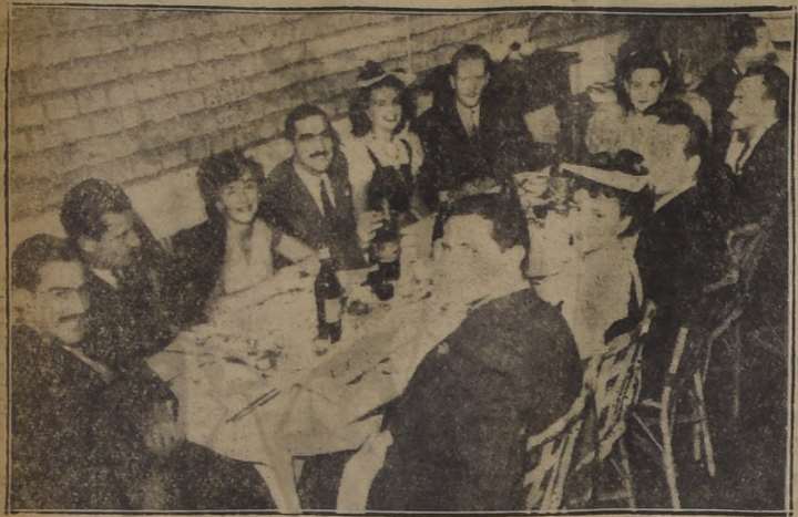
Aspecto parcial de la terraza de la Hosteria de Providencia, cuyo agradable local es frecuentado, a las horas de comida, por una distinguida concurrencia.