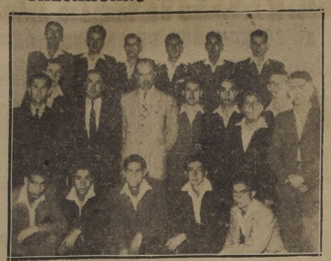
Instructores y alumnos de la Escuela de aprendices a obreros del Arsenal Naval de Talcahuano, durante su visita a LA NACION

Ayer visitaron “LA NACION” los instructores y alumnos de la escuela de aprendices a obreros del Arsenal Naval de Talcahuano, que efectúan una gira de estudio.