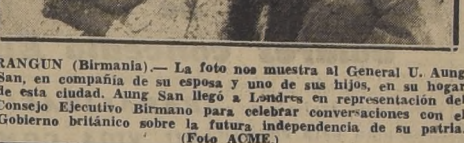
RANGUN (Birmania).— La foto nos muestra al General U. Aung San, en compañía de su esposa y uno de sus hijos, en su hogar de esta ciudad. Aung San llegó a Londres en representación del Consejo Ejecutivo Birmano para celebrar conversaciones con el Gobierno británico sobre la futura independencia de su patria.