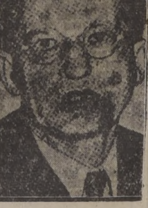
A. de Gasperi se despide del pueblo de Estados Unidos

Declaró que si tiene tiempo visitará al Premier Blum en la capital francesa