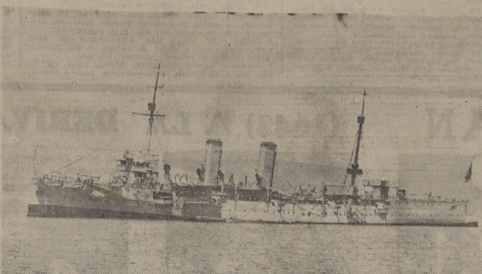
El "Chacabuco" que es el único crucero de la Marina de Guerra, y que ya cuenta con 45 años de servicios.

Desgraciadamente la falta de una legislación especial ha impedido que Estados Unidos venda a Chile modernos barcos de combate, sólo ha podido vender buques auxiliares, como ser las corbetas y fragatas que ya llegaron al país, y ahora, dos transportes y cinco de velas barcazas de desembarco.