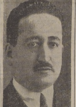
Gustavo Rivera Baeza, presidente del Partido Liberal

En cuanto a la repatriación de los 6.000 chilenos que hay en Europa, se nos informó que se está gestionando el fletamiento de un barco especial con este objeto.