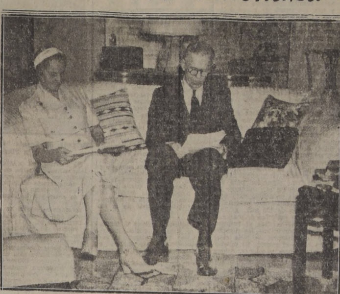
NUEVA YORK.—Aquí vemos al general George C. Marshall en su hogar, en compañía de su esposa.