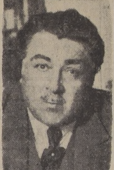
Señor JUAN PRADENAS MUÑOZ. Trabajo, ante el Excmo. Sr. Gabriel González Videla, asumió sus funciones de inmediato.

EXPRESA D. JUAN PRADENAS MUÑOZ AL PRESIDENTE