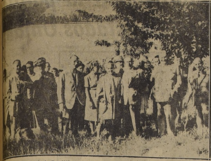
El Presidente de la República, y señora de González Videla, y huéspedes del Gran Hotel Termas de Puyehue, durante una visita a la isla Fresia.