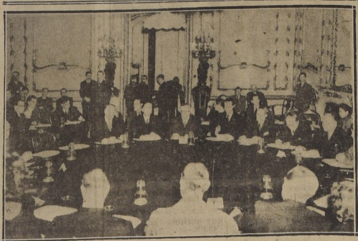
LONDRES.— Vista general de la reunión inaugural de los Ministros de Relaciones Exteriores británicos Mr. Ernest Bevin, en compañía de M. Gusev, delegado del Ministro de Relaciones Exteriores soviético, a la extrema derecha.