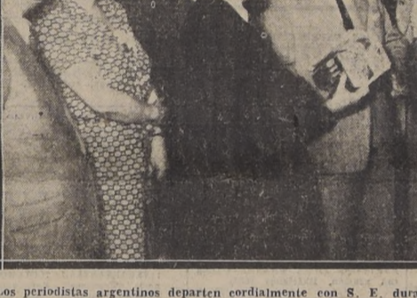
Los periodistas argentinos departen cordialmente con S. E. durante la audiencia especial que les concedió a mediados de ayer.

S. E. ESTA SEGURO QUE EL TRATADO SERA RATIFICADO POR EL CONGRESO