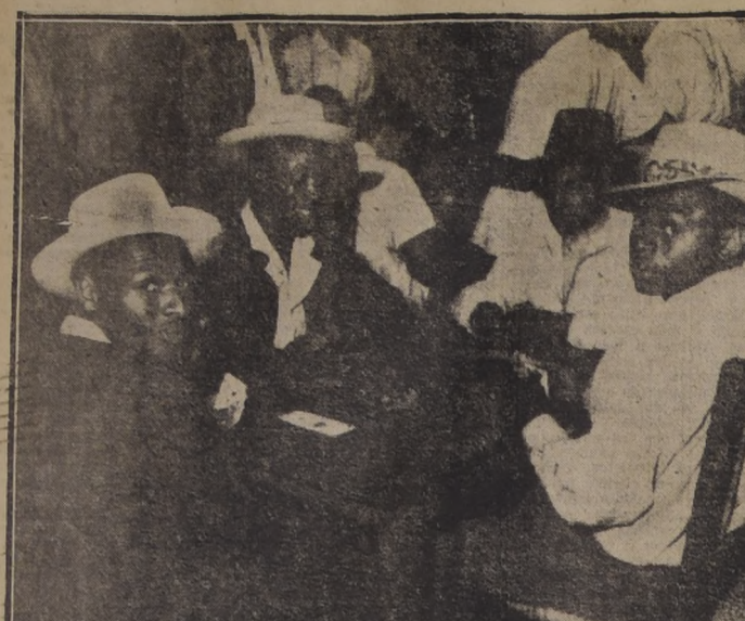
LOS DEL ALIANZA SE ENTRETENEN.— Los oscuros cracks de Alianza se entretienen en su concentración de Peñaflor jugando a las cartas