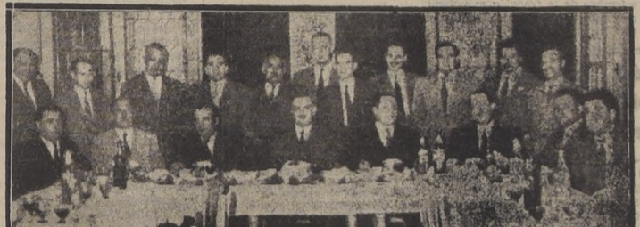
Comida ofrecida en el Stade Francais, con motivo de la elección de Directorio de la Unión de Fabricantes de Pan de Santiago.