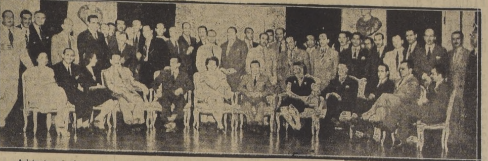
Asistentes al cóctel ofrecido en el Salón de Honor del Hotel "Carrera", por la Panagra a la delegación de periodistas argentinos que visita esta capital.