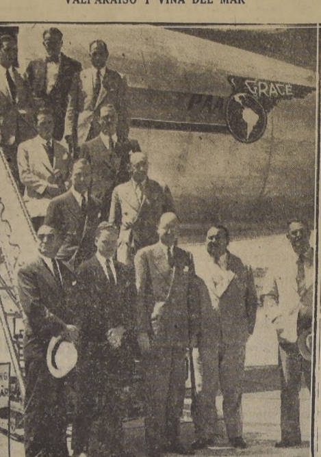
Representantes argentinos en Los Cerrillos

CONOCERAN LOS PRINCIPALES ATRACTIVOS NATURALES QUE TIENE NUESTRO PAIS.— HOY SE DIRIGEN A VALPARAISO Y VIRA DEL MAR