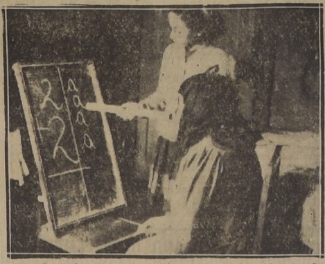
Una voluntaria del Cuerpo Cívico de Alfabetización, enseñando a leer a un analfabeta.