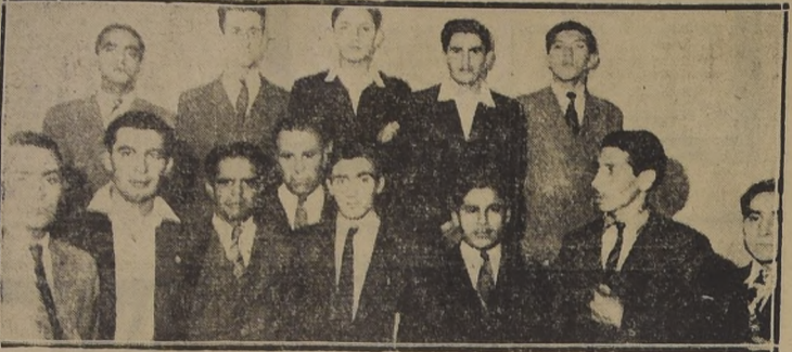
Parte de los empleados secundarios del Comisariato de Subsistencias y Precios

PIDEN TAMBIEN SER INCLUIDOS, COMO ANTES, ENTRE LOS EE. PUBLICOS A CONTRA.— DEVOLUCION DE GARANTIAS QUE LOS FAVORECIAN