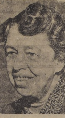
Mrs. Eleanor Roosevelt