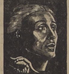
Federico Gamboa: 'De Barra Somos', plantea y resuelve dicho problema de una manera magistral, y la filmación de este asunto se podrá ver el día que indicamos al iniciar este comentario.

Todo un acontecimiento cinematográfico será el estreno de la película 'De Barra Somos', que el martes próximo se estrenará en el Teatro Santiago. Esta historia tomada de la obra postuma de don Federico Gamboa, ha sido adaptada a la pantalla por Emilio Fernández y Mauricio Magaña, teniendo en su reparto a destacadas figuras de la cinematografía mexicana, como Carmen Montejo, Anita Blanch, Rafael Baleón, Pedro Armendáriz y actuación especial de Isabella Corona.