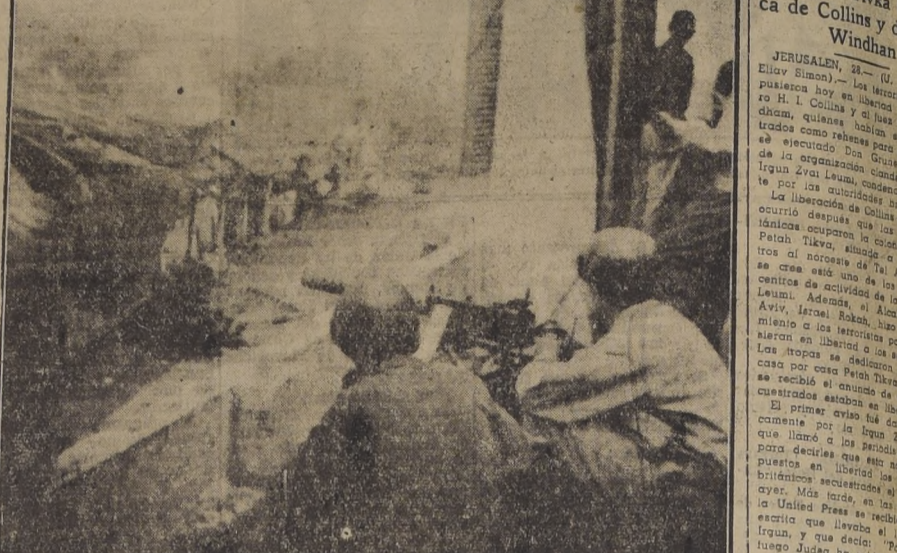
INDOCHINA.— Dos soldados franceses para petidos en una casa, apuntan una ametralladora hacia una vivienda ocupada por fuerzas rebeldes. Por razones de estrategia no se da a conocer el nombre de la ciudad.