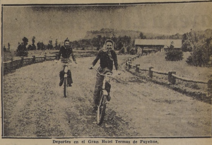
Deportes en el Gran Hotel Termas de Puyehue.