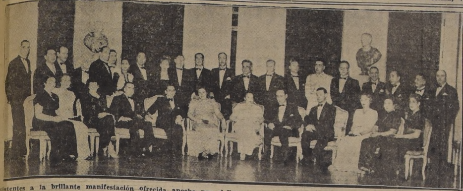
Asistentes a la brillante manifestación ofrecida anoche por el Excmo. señor Embajador de la URSS al Embajador de Chile en Moscú