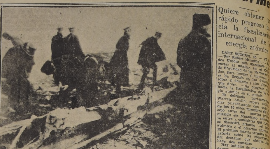
COPENHAGUE.—El accidente de aviación que costó la vida al príncipe Gustavo Adolfo y a la actriz Grace Moore. Una partida de obreros de salvamento examina los restos carbonizados del avión Dakota que se precipitó en el acróstico de Kastrip en esta capital, el 26 del presente, y donde murieron el príncipe Gustavo Adolfo de Suecia, y la actriz y cantante Grace Moore.