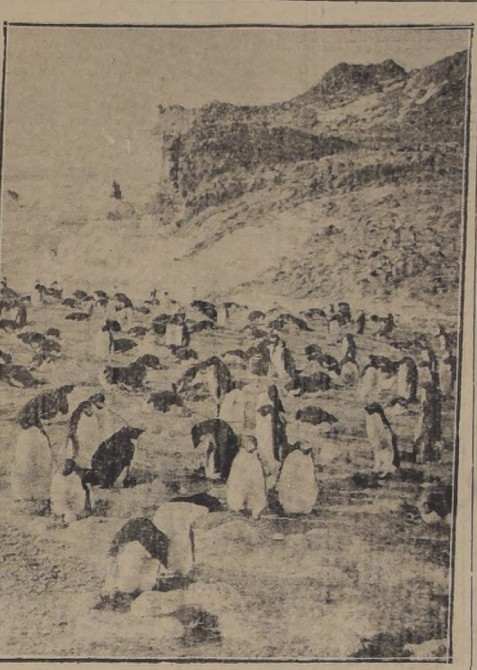
Grupo de pingüinos imperiales en una isla de la Antártica.