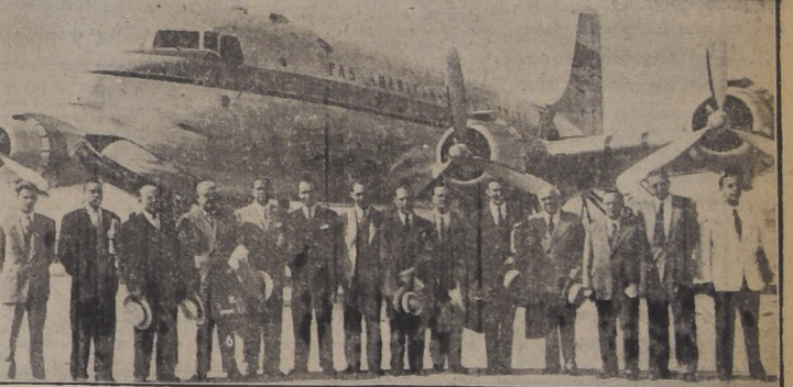
La delegación de empresas turísticas de Santiago momentos antes de dirigirse a Buenos Aires en visita de acercamiento con las congéneres de esa capital

48 nuevos cursos en los Liceos de Hombres y Niñas del país. LOS CURSOS SERVIDOS POR PROFESORES A CONTRATA TENDRAN EL CARACTER DE PERMANENTES.— IMPORTANTES MEDIDAS ADOPTADAS POR EL MINISTRO DE EDUCACION Y EL DIRECTOR DE EDUCACION SECUNDARIA