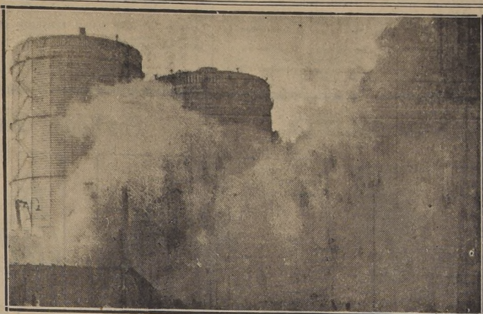
Los gasógenos, que guardan miles de metros cúbicos de gas, y cuya explosión habría provocado una catástrofe.— En la foto aparecen envueltos en el humo del incendio