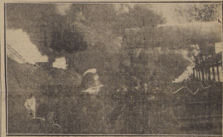
Los obreros de la fábrica de gas cooperaron valientemente a la labor de los bomberos.— He aquí un aspecto del dramático trabajo de extinción del fuego.

Los daños fueron avaluados en $ 300.000, y corresponden, en casi su totalidad a las instalaciones de la Sociedad Química Nacional, cuya planta de elaboración de subproductos fue reducida a escombros. En cuanto a los seguros, éstos ascienden a seis millones de pesos, que la mencionada sociedad tiene en dos compañías.