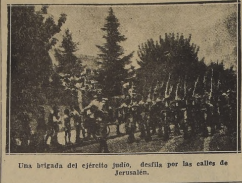
Una brigada del ejército judío, desfila por las calles de Jerusalén.

Ocupó puntos estratégicos en la región que los judíos reclamarán si se efectúa la partición