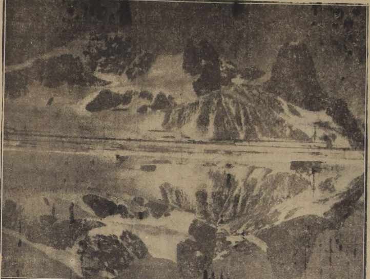
Bahía de la Isla Margarita, donde se juntarán la fragata "Iquique" y el transporte "Angamos" para iniciar la exploración de la Antártida.