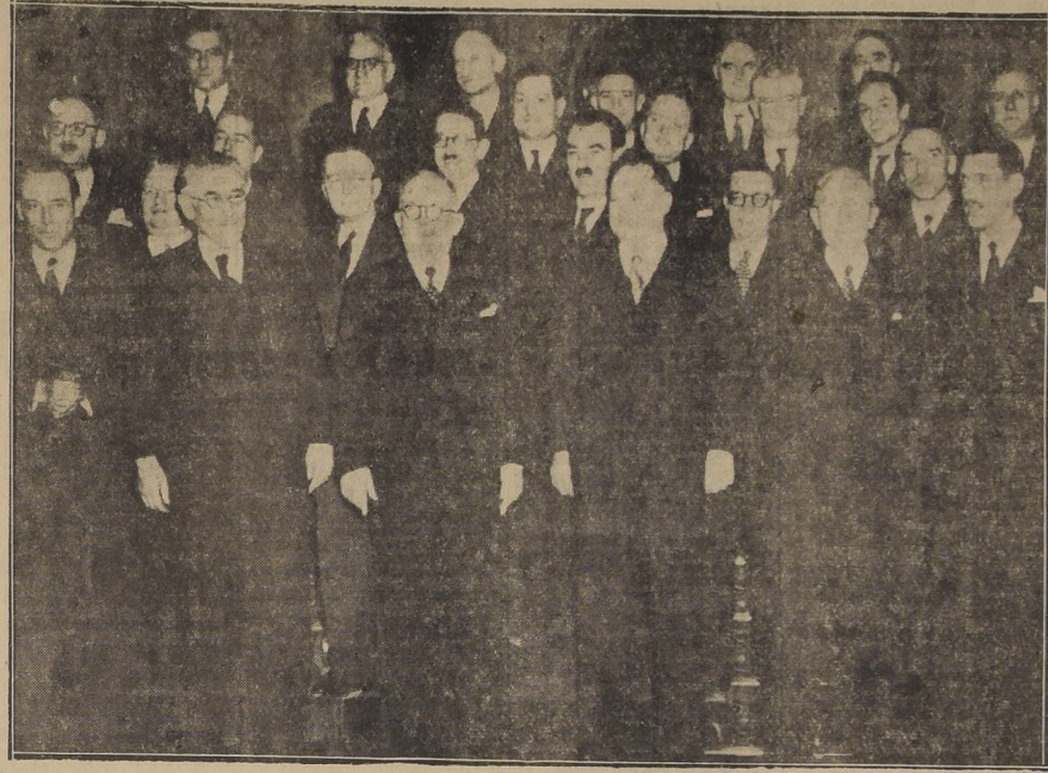
El Presidente de Francia M. Vincent Auriol, aparece rodeado de su primer Gabinete. El Mandatario francés, tiene a derecha e izquierda a M. Ramadier, Presidente del Consejo, y a M. Thores, Vicepresidente M. Bidault, Ministro de Relaciones, está detrás de M. Auriol.

Los delegados de las Naciones Unidas han resuelto devolver el asunto al Consejo de Seguridad