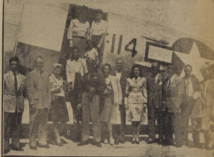
Un grupo de personalidades norteamericanas y brasileñas parten en un Douglas desde Los Cerrillos a pasar el week-end al Gran Hotel Termas de Puyehue.