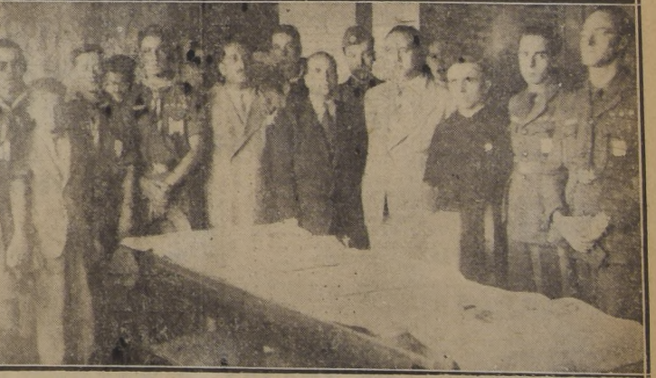
Los scouts peruanos, acompañados de sus jefes, visitan nuestro diario