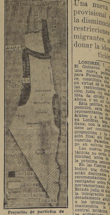
Proyectos de partición de Palestina.