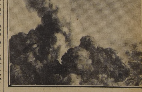
Efectos de la explosión de la bomba atómica lanzada, casi al finalizar la guerra, en Hiroshima. El humo alcanzó a más de 40 mil pies de altura.

Alarma en los círculos oficiales norteamericanos