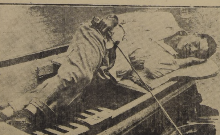
JOE LOUIS es uno de los boxeadores que jamás ha descuidado su entrenamiento y apesar de que es un campeón de popularidad mundial no se ha dejado llevar de esa fama, para dedicarse a una vida relajada. Gran entusiasta por la pesca, aquí vemos a Joe Louis, durmiendo en su bote, después de un laborioso día dedicado al deporte de la caña.

El público comenta entusiasmado en todos los círculos la próxima llegada del campeón del mundo de todos los pesos, el negro Joe Louis. Hemos sido informados que Louis y su numerosa comitiva se embarcarán en un avión de la Panagra, en la ciudad de Lima, el domingo próximo, a las 23 horas para llegar a Los Cerrillos a las 8.30 horas del lunes. La exhibición de Louis está anunciada para el miércoles próximo en el Estadio Nacional. En esta ocasión el negro se servirá de Arturo Godoy, nuestro popular y fuerte campeón, para hacer una de las demostraciones más interesantes de boxeo que se han visto en Chile, pues es primera vez que veremos un verdadero campeón del mundo y en pleno apogeo.