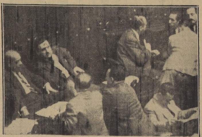
En los bancos radicales se comenta el resultado de las votaciones del proyecto de sindicación campesina en la Cámara de Diputados.

LIBERALES Y CONSERVADORES VOTARON VIRTUALMENTE UNIDOS SE ACEPTO LA INDICACION RADICAL PARA ALZAR LA ASIGNACION FAMILIAR DEL 7 AL 10 POR CIENTO, DEJANDO UN 3 POR CIENTO PARA LOS SINDICATOS SE ESPERA VETO PRESIDENCIAL