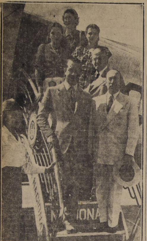
Un grupo de personalidades argentinas parte rumbo al Aéreo Puerto del Gran Hotel "Termas de Puyehue" en un Douglas de la Línea Aérea Nacional.