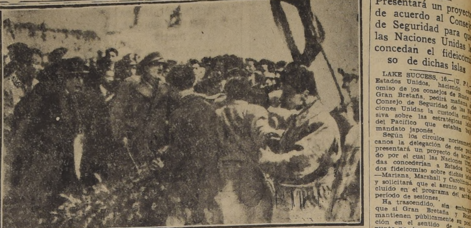
ROMA.—Disturbios en protesta por firma del tratado de paz. Cientos de estudiantes que habían colocado una corona en la tumba del Soldado Desconocido, en esta capital, durante una ceremonia en la Plaza Venezia, fueron dispersados por la fuerza por la policía italiana.