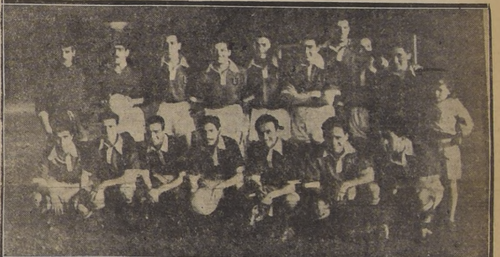
JUGO BIEN EN ROSARIO.— Luego de sufrir una aplastante derrota frente a Estudiantes de la Plata, el equipo de fútbol de la "U" se rehabilitó frente a Independiente. En el partido que sostuvo el jueves en Rosario, por día, pero su desempeño fué muy superior a todos los cumplidos con anterioridad.

BUENOS AIRES, 14.— (Por correo aéreo).— La "U" finalizó anoche sus compromisos con una gran actuación frente a Newell's Old Boys. Era la última oportunidad que teníamos de obtener un triunfo en canchas argentinas, razón por la cual entramos al field dispuestos a jugarlos enteros. Y así fué. El equipo actuó como en sus