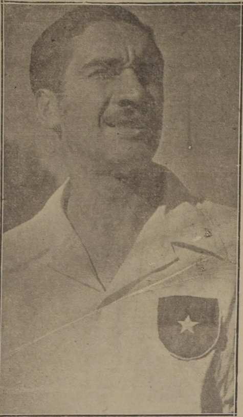
ALCANTARA. —Delantero internacional del Colo Colo, que desea rehabilitarse en el encuentro que su conjunto sostendrá el sábado con el Alianza de Lima.

—Al año siguiente volví a Plumerillo. Esta vez se congregaron los mejores “cracks” argentinos, uruguayos y brasileños, con unos Alfa-Romeo que en las rectas desarrollaban una velocidad fantástica. A sabiendas que la opción de los chilenos era nada por la menor capacidad de las máquinas, se nos invitó a que corrieramos los frenos; entonces, la ventaja que se sabían los argentinos con sus Alfa-Romeo y Meseratis, se