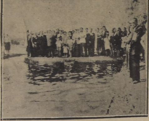
Durante el acto de la inauguración de la piscina popular de Talagante

ESTA UBICADA A ORILLAS DEL MAPOCHO, Y SUS AGUAS EMANAN DE UNA VERTIENTE.— PUEDE SER SITIO FAVORITO DE LOS VISITANTES A ESTE PUEBLO