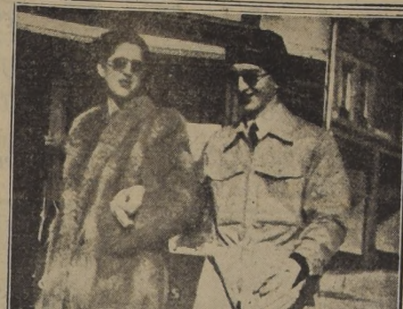
SAINT MORITZ, Suiza.—El ex Rey Pedro de Yugoslavia, y su esposa la ex princesa Alexandra de Grecia, toman un paseo por las calles de esta localidad, que aparecen cubiertas de nieve...