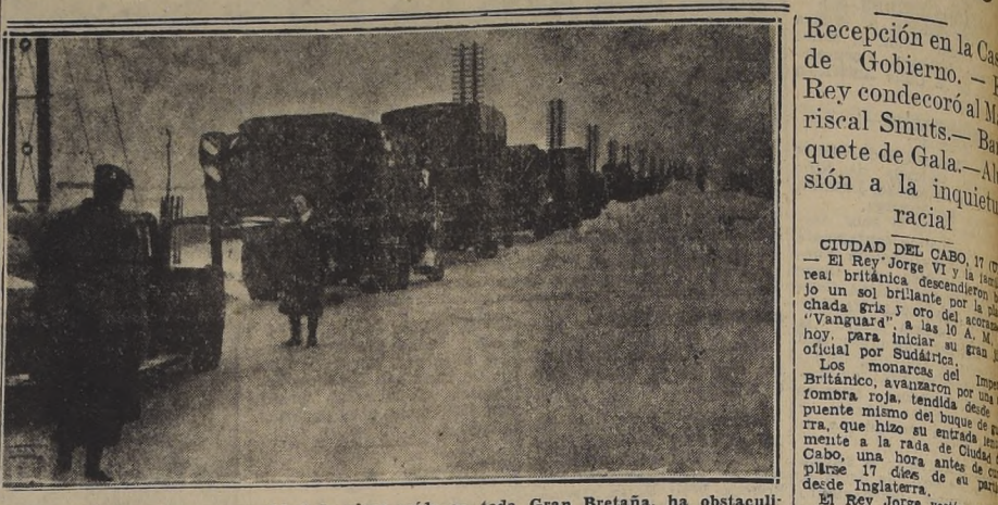
INGLATERRA. — La gran cantidad de nieve caída en toda Gran Bretaña, ha obstaculizado el tránsito ferroviario y caminero, y ha aislado numerosas aldeas. La foto permite apreciar la intensidad de las nevadas.