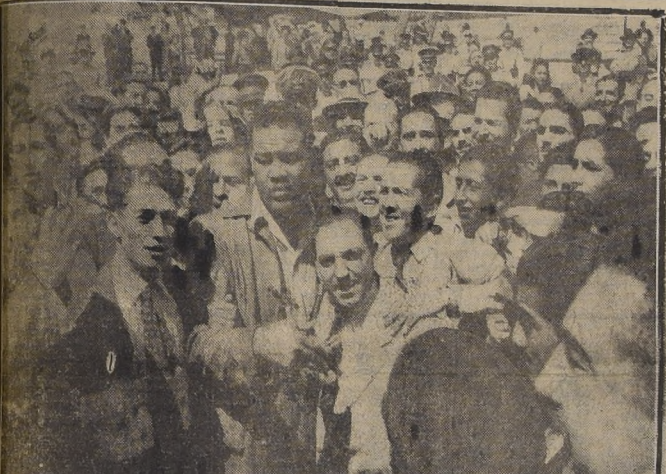
Tan pronto bajo Louis del avión que lo traía de Lima, un público inmenso se avalanzó sobre el campeón del mundo para aplaudirlo y demostrarle su simpatía. Louis contestó con una pequeña sonrisa las atenciones del público chileno.