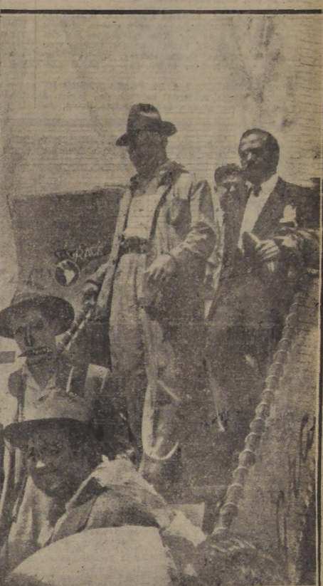
Entonces, con una gran serenidad y sin demostrar inquietud alguna, bajo Joe Louis del avión que lo trajo de Lima. Su traje era café, e igual su sombrero. Llamó la atención su camisa amarilla llena de flores de diversos colores. Llamó su mejor arma y la más fuerte. Al hablar de sus golpes, el negro se mostró muy entusiasmado de su izquierda, a quien la

DECLARACIONES ANTE LOS PERIODISTAS A las 15 horas el popular boxeador se hizo presente en uno de los salones del Hotel Savoy para hacer algunas declaraciones