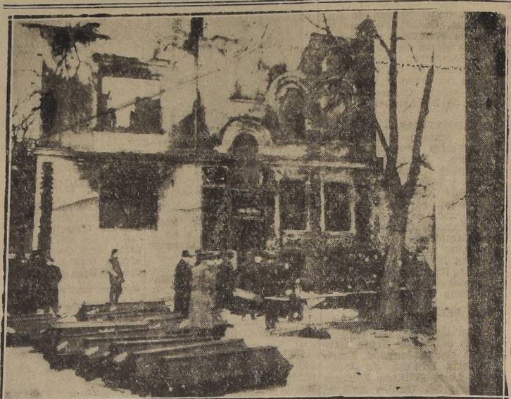
Grupos de curiosos se aproximan a ver las ruinas que quedaron del reciente incendio de un gran club en Berlín.

Más de 16 muertos y 200 heridos en el balance tras hasta el momento Montaña de ruinas