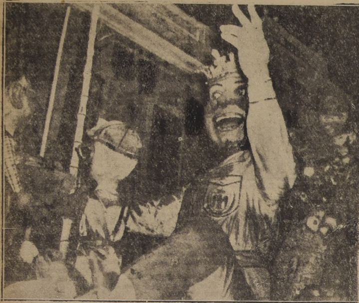
NIZA.— El 7 del actual se inició la celebración del carnaval en esta ciudad. Aquí vemos a Su Majestad "Carnaval" haciendo su entrada a la ciudad.