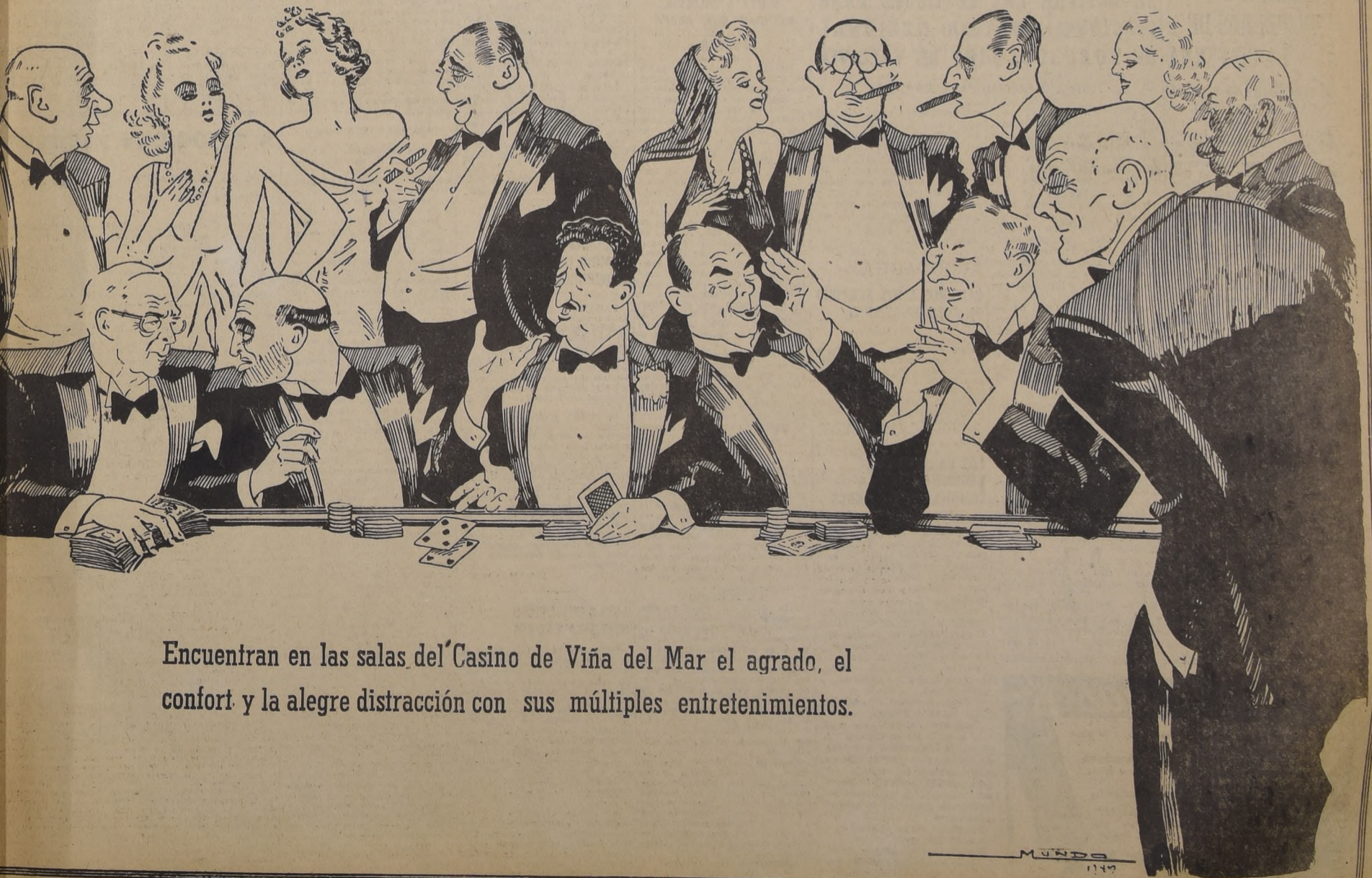
Encuentran en las salas del Casino de Viña del Mar el agrado, el confort y la alegre distracción con sus múltiples entretenimientos.