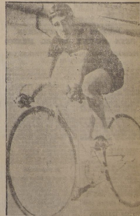
LEOPOLDO OSORIO. — Ganó en gran forma los 3 mil metros para novicios, con 43".