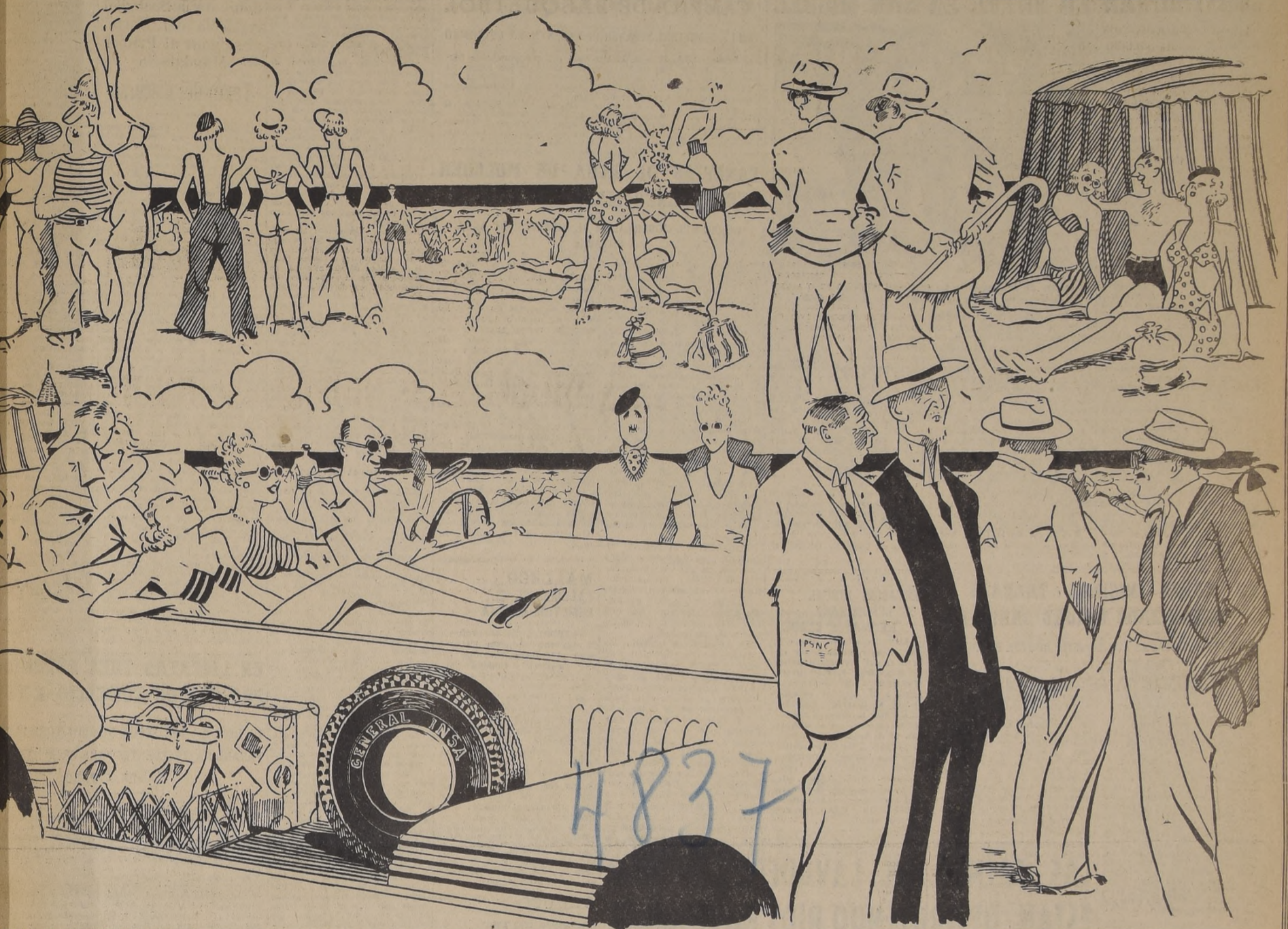
ES DE VERANEANTES, DESPUES DE DISFRUTAR DE GRATOS MOMENTOS DE SOLAZ Y EXPANSION EN LAS HERMOSAS PLAYAS DEL BALNEARIO