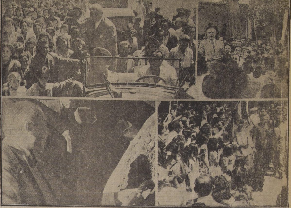
Diversos aspectos de la brillante jira del Primer Mandatario por la provincia de Coquimbo. En el ángulo superior izquierdo S. E. llega a la ciudad de Vicuña en medio del entusiasmo popular. Haciendo uso de la palabra en Los Cardos. El señor González Videla procede a colocar la primera piedra del futuro Teatro de Vicuña. — Visitando los establecimientos educacionales de la ciudad

El tratado con la República Argentina es, a no dudarlo, la empresa más seria en que el Gobierno se ha comprometido. Antes de pactarlo, consideré el Ejecutivo que la interdependencia de las naciones es un hecho que nuestro tiempo ha impuesto. Es falso concepto el que parte de considerar a los países en situación de perfecta autonomía. No. Las naciones viven influyéndose mutuamente. Su producción repercute sobre la de sus vecinos. Su riqueza se manifiesta más allá de sus fronteras. Lo inteligente y realista es, por consiguiente, considerar estos fenómenos y llevar a los pueblos a aprovecharlos en beneficio recíproco. El Tratado con Argentina se justifica en hechos simples de relación. Ellos son: la abundancia de capital en la República hermana, nuestra carencia de capitales y la posibilidad de colocar nuestros productos en la nación vecina, unida a la de recibir los productos argentinos en nuestra tierra. En la imposibilidad de analizar extensamente las