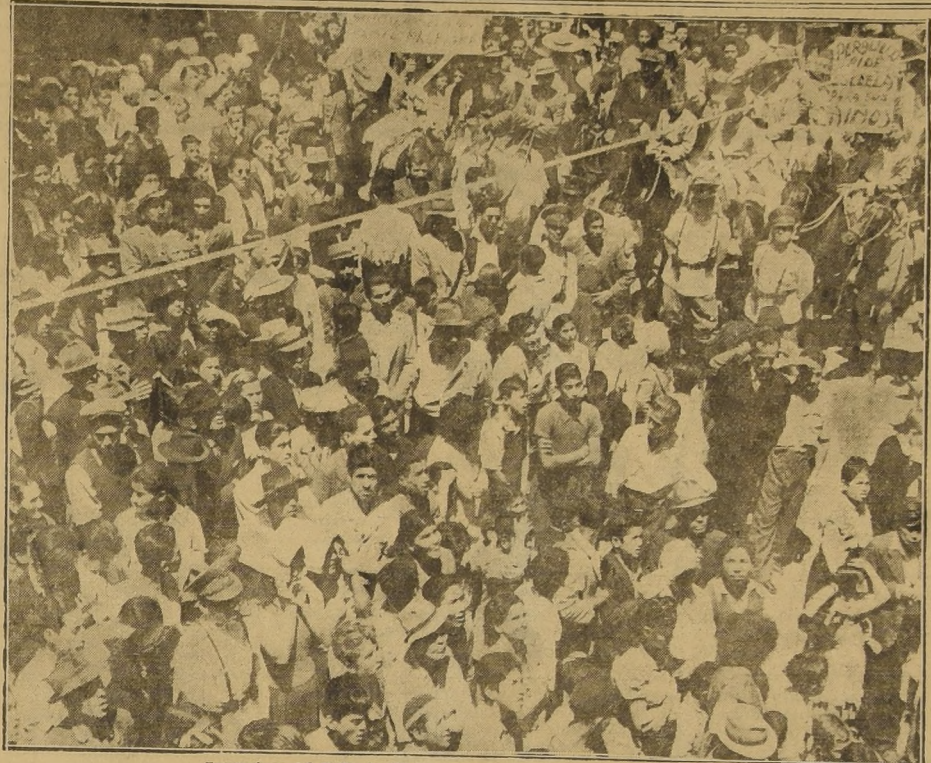
Campesinos del Valle de Elqui escuchan la palabra del Primer Mandatario