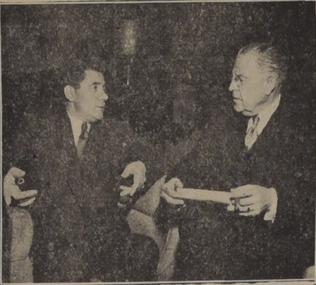
El representante del Soviet, Andrei A. Gromyko, y Warren R. Austin de los Estados Unidos, conversan informalmente en el salón de descanso de los delegados en la sede de las Naciones Unidas, después de la reunión en la cual los representantes reanudaron el estudio del desarme, información sobre tropas y energía atómica. Lake Success, Nueva York, 4 de febrero de 1947.

Los padres de los niños que no pueden ser muy graves. Empero, la velocidad que avanza ahora el torrente de lava, tal posibilidad es remota."