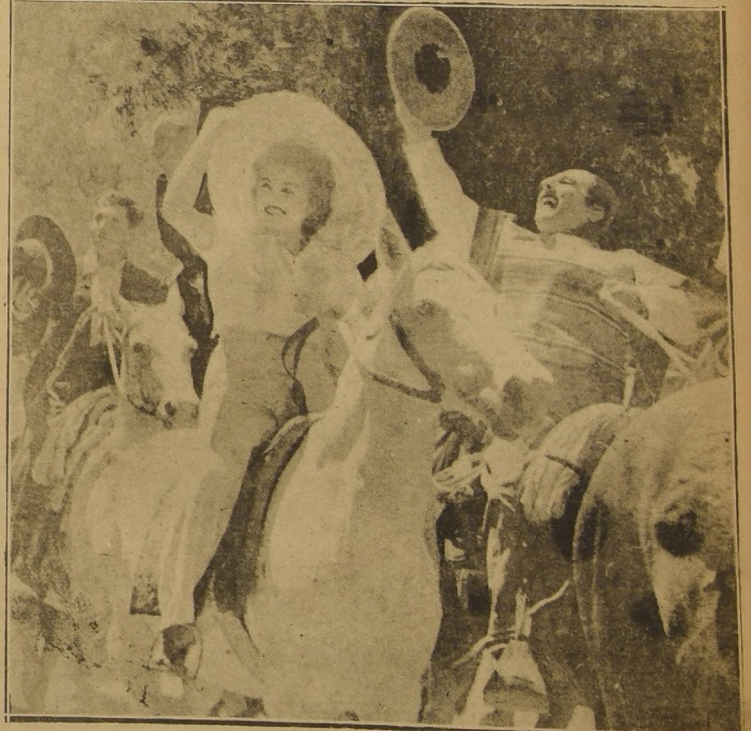
Huascos del "Norte Chico" desfilan y saludan entusiastamente al Primer Mandatario de la Nación