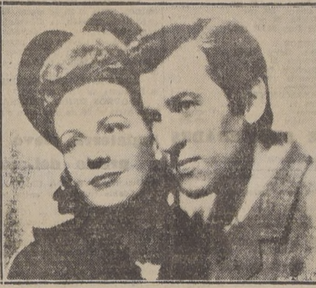
Phyllis Calvert y Stewart Granger, la pareja romántica de "Amor en las Sombras"

portalgas, Casa Salomé, Estado 238; un par de chinas de seda, Zapatería La Argentina, Estado 333; un frasco de perfume, Casa Max Factor, Estado 340; una elegante caja para cigarrillos, Casa Camello y Soza, Ahumada 132; una camisa marca Falabella, Sastretería Falabella.