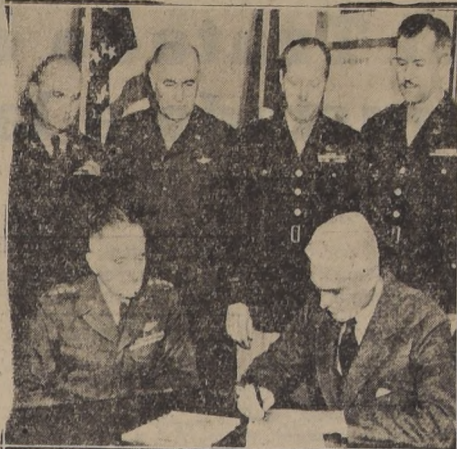
OAK RIDGE, Tennessee.—El general Carl Spaatz, sentado a la izquierda, comandante de las fuerzas aéreas del Ejército...