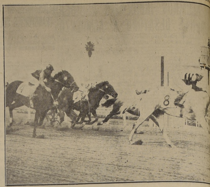
En violenta atropellada final, el torcido Olhaverri (8) cruza victorioso la raya por medio cuerpo sobre Santa Anita (7), sorprendiendo a la cátedra y ganando los cien mil dólares del famoso Handicap de Santa Anita. En el tercer lugar, el favorito Armad, se agotó en la recta final. Tercero llegó Pere Time (4), y cuarto See-See-See (3). El gran favorito Armad, se agotó en la recta final, quedándose solamente quinto. Olhaverri pagó 32.70 dólares por unidad de 2.—(Foto ACME)