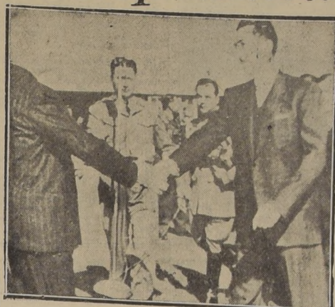
CIUDAD DE MEXICO.— El Presidente de México, señor Miguel Alemán, saluda al Presidente Truman, de los Estados Unidos, a su llegada a la capital mexicana, en su avión particular, el 3 de marzo, en visita oficial de tres días. Esta fue la primera vez que un Presidente de los Estados Unidos visita la capital mexicana.

El discurso constituyó un verdadero discurso de paz, en el que el presidente Truman, en un extenso discurso pronunciado en la Universidad de Taylor, donde se le confirió el título de Doctor Honoris Causa, manifestó que el mejor sistema de asegurar la paz es la cooperación económica entre las naciones, que Estados Unidos debe ampliar su programa de tratados y reciprocidad de comercio, para lograr dicho objetivo.