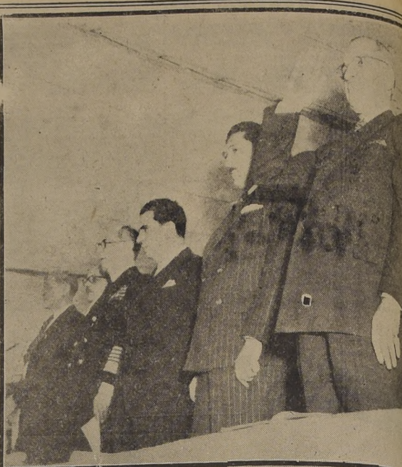
CIUDAD DE MEXICO.— El Presidente Truman saluda con la mano derecha a las banderas de México y Estados Unidos, en la fiesta popular organizada en el Estadio Nacional de la capital.— De recha. a izquierda: Truman, Miguel Alemán, de México; el Canciller mexicano Torres Bodet, el Embajador mexicano en Washington, Espinoza de los Monte...

BUENOS AIRES, 8.— (UP).— El Ministro de Relaciones de Chile, señor Raúl Juliet, visitó al Presidente Perón acompañado del Canciller, señor Juan A. Bramuglia y del Embajador chileno, señor Alfonso Quintana Burgos, para despedirse oficialmente con motivo de su regreso a Santiago el domingo por la mañana. El Canciller chileno, señor Juliet, se despidió oficialmente del Presidente Perón, en una breve audiencia, a la cual fue acompañado por el Embajador chileno, señor Quintana Burgos, y el Canciller argentino, señor Juan A. Bramuglia. El señor Juliet permaneció tres días en Buenos Aires, de regreso de Montevideo, donde presidió la misión extraordinaria de su país a la transmisión del mando, durante su permanencia en esta, el señor Juliet aprovechó la ocasión para conferenciar y aclarar la interpretación de algunas cláusulas del convenio comercial suscripto entre las dos naciones. El Canciller argentino, señor Bramuglia, ofreció hoy un almuerzo íntimo a su colega chileno, a cual fueron invitadas también algunas personas, incluyendo, a altos funcionarios locales y al personal superior de la Embajada.