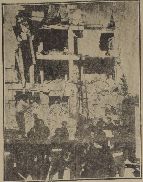
JERUSALEM.— Estado en que quedó el edificio del Club de Oficiales Británicos en Jerusalem, volado por los terroristas judíos el 1.º de marzo. Murieron dieciséis personas. Los terroristas lanzaron un camión cargado de explosivos sobre el edificio. En la foto se ven restos del camión, detrás de

Al mismo tiempo, un grupo de soldados británicos en una calle cercana, fue atacado con fuego de morteros y los estancos de petróleo en las proximidades de la estación ferroviaria de Tel Aviv, fueron incendiados por otro grupo de extremistas.