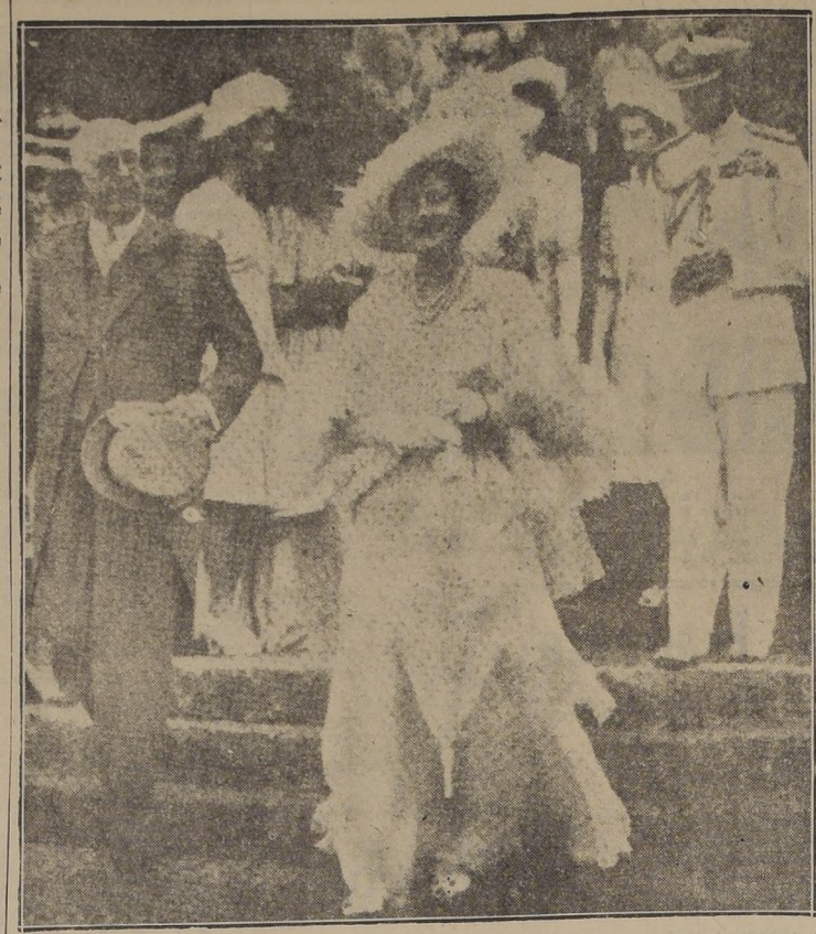
La Reina Isabel y la familia real, durante una reciente recepción en Ciudad del Cabo