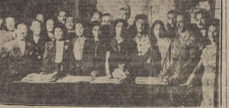
Son 24 universitarios peruanos, de la Facultad de Educación de la Universidad de Lima, que ayer visitaron "LA NACION". Con alegres frases, nos dijeron que más allá de la línea Concordia, nos querían mucho.

ANOCHÉ LLEGARON A ESTA CAPITAL PROCEDENTES DE VALPARAISO