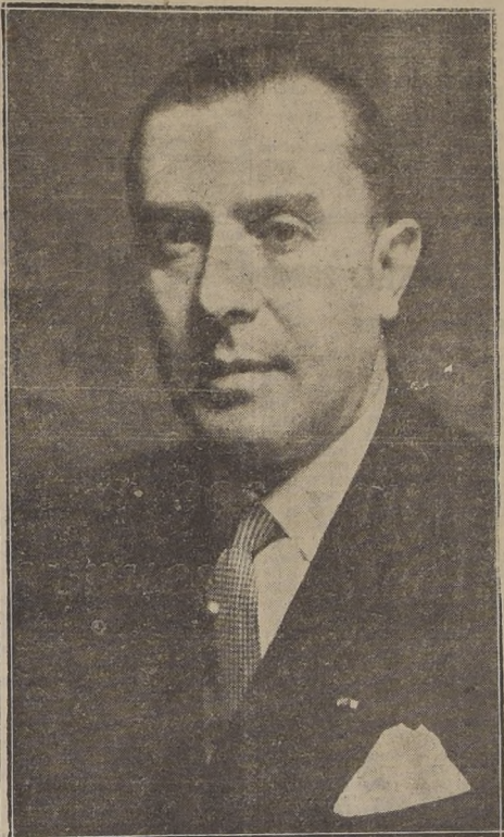
S. E. el Presidente de la República, don Gabriel González Videla