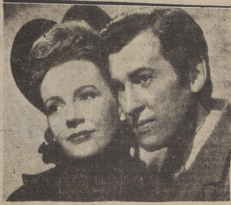
Divyllis Calvert y Stewart Granger, la pareja romántica de "Amor en las Sombras"

En la fin del novedoso Concurso "Amor en las Sombras" que se ha desarrollado bajo los auspicios de LA NACION, Artistas de las casas comerciales de Santiago, con el patrocinio de la cinta "Amor en las Sombras", que se exhibe en el Teatro Bandera, se ha despertado el interés en el público, el cual ha estado enviando innumerables soluciones. No obstante, el concurso se espera que al día siguiente llegue el grueso de las respuestas. En el papel aparte, se han publicado los nombres y direcciones de los 68 ganadores. Los ganadores recibirán en sus casas, cada uno un cupón. Las respuestas deben ser enviadas a la Sección de Concursos de LA NACION, en un sobre depositado en un buzón instalado en el Teatro Bandera. El cupón que se envía a los ganadores, se entregará a los ganadores en un sobre depositado en un buzón instalado en el Teatro Bandera. El cupón que se envía a los ganadores, se entregará a los ganadores en un sobre depositado en un buzón instalado en el Teatro Bandera.