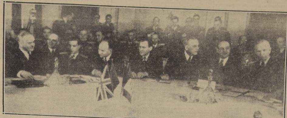
MOSCU.—El Ministro soviético de Relaciones Exteriores, Via cheslav M. Molotov (extremo izquierdo), y el Secretario de Estado norteamericano general George C. Marshall (extremo derecho), aparecen junto con sus asesores en torno de la mesa de la Conferencia, en la sesión inaugural de la reunión de los Ministros de Relaciones Exteriores de los Cuatro Grandes, en el edificio de la Industria de la Avia ción Soviética, el 10 de marzo.—(Radiofoto ACME).