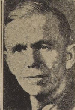
El general Marshall

(U. P.). — (Por R. ... El Secretario de ... Marshall, en una ferviente ... al establecimiento de ... real para todas las ... al Consejo de ... Relaciones Exteriores, ... las ideas ... en ese ... que todos los sectores ... alemán tienen acceso, ... a informaciones de ... de hoy fué la más ... de los cinco efectuadas ... en que se inició la ... que no estaba com- ... de acuerdo con la de- ... de la democracia dada pos- ... y añadió que posterior- ... en forma más es- ... las sugerencias del Secre- ... Estado norteamericano. ... este estudio dedicado prin- ... a la lectura de los des- ... de la desmilitarización de ... y no hubo polémica al-