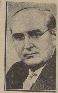
El senador Vandenberg

El mensaje de Truman al Congreso ha hecho que se mencione la Doctrina Monroe en los debates políticos, por primera vez desde que Roosevelt subordinó el "monroísmo" al concepto del "buen vecino" en las relaciones panamericanas. Esto se debe al hecho que históricamente Estados Unidos ha adoptado la "tesis regional" en sus relaciones internacionales sólo en lo referente a la defensa del Hemisferio occidental.