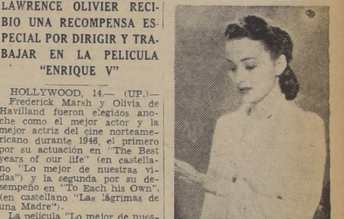
Olivia de Havilland

Actualmente hay 90 niños y 25 niñas en el Asilo, y todos piensan con indelible gratitud y amor a sus bondadosos hermanos: los niños chilenos.