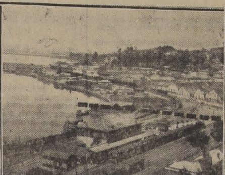
Una vista de la zona portuaria de Talcahuano