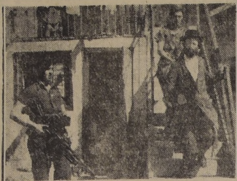
Busca de terroristas en el antiguo sector judío de Jerusalén

SHANGHAI, 20.—(U. P.).— Despachos fechados en Mukden comunican que las tropas de las guardias chinas hicieron fuego sobre seis submarinos de nacionalidad desconocida que aparecieron frente a la costa oriental de la península de Liaotung, en Manchuria. Dicen que los submarinos se retiraron, al parecer sin haber sufrido daños. Según los despachos, los soldados chinos abrieron fuego cuando los submarinos no quisieron responder a las señales que se les hicieron de tierra. No ha habido confirmación oficial de esta información.